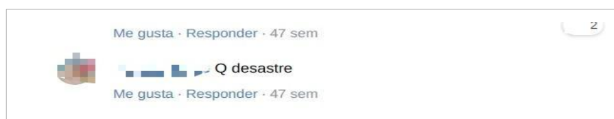
Figura 1. Publicación A.

El cuerpo de contenido de la primera publicación seleccionada (2018.1) es un texto político y crítico de un delegado sindical, autor de otras publicaciones en el grupo y con mucha repercusión dentro del mismo. De los/as tres participantes de la publicación, uno es el autor/iniciador y las otras dos participantes podrían encuadrarse según Ponce Rojo et. al. (2012) bajo la denominación de apoyadores sin fundamento, ya que no aportan pruebas ni argumentan sobre el contenido de la publicación, sólo apoyan las palabras del autor (Figura 1).