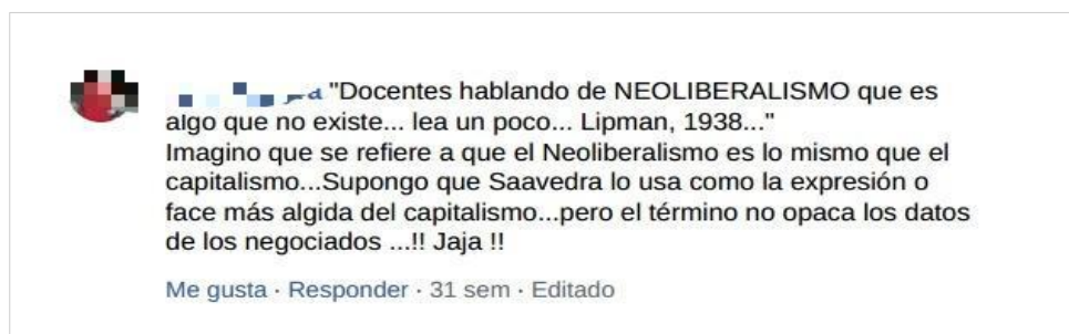
Figura 4. Publicación D.

Los dos comentarios están dirigidos hacia uno de los comentaristas que se posicionó en contra del autor, y sugieren la confiabilidad del autor de la publicación que genera estos actos de defensa.