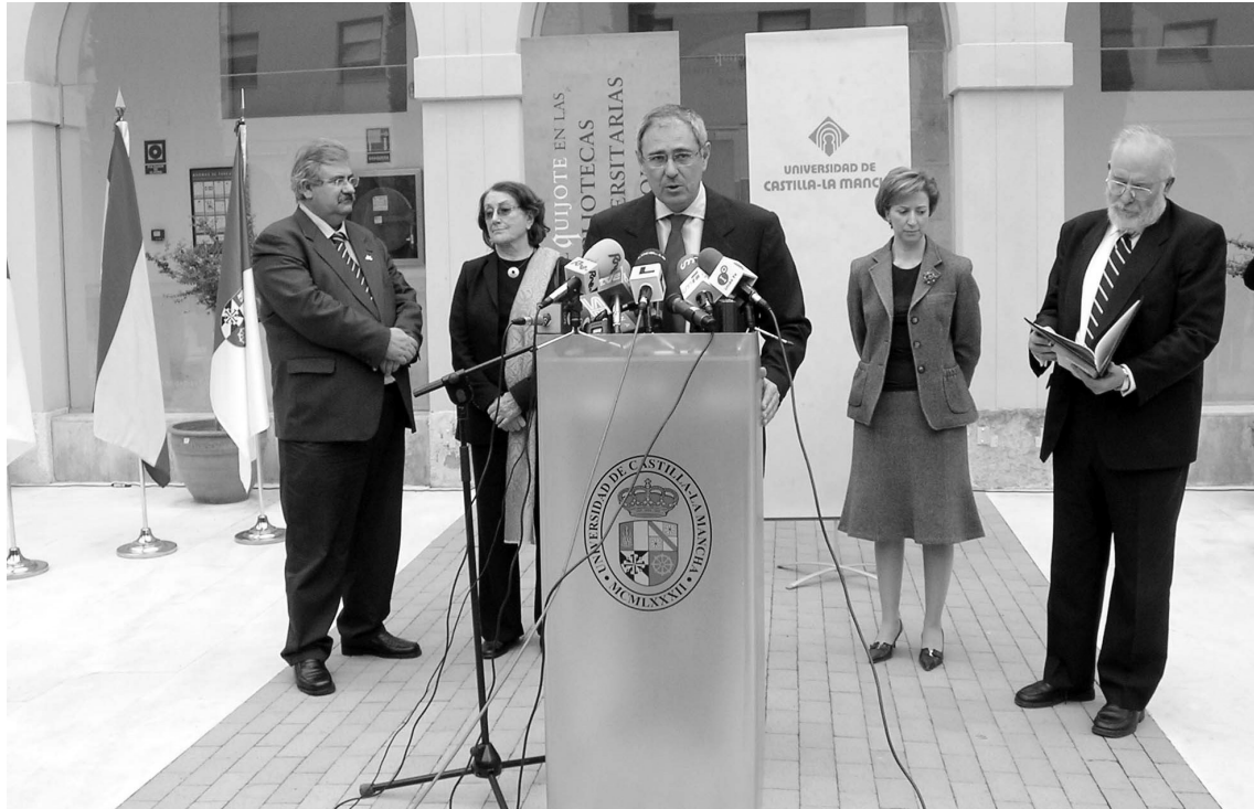
Inauguración de la exposición “ El Quijote en las Bibliotecas Universitarias Españolas ”.

net.unirioja.es/), donde se vacían diariamente más de 2.600 títulos de publicaciones periódicas, ofreciendo a los usuarios, además de su consulta, la posibilidad de recibir alertas por correo electrónico, cada vez que se actualizan los datos de los títulos de su interés.