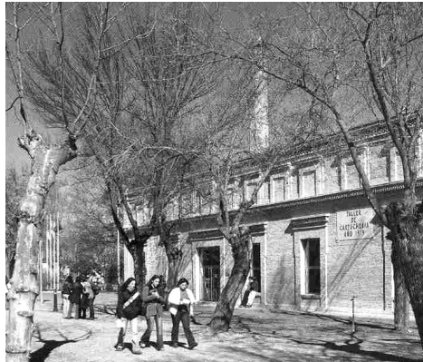
Biblioteca de la Fábrica de Armas. Toledo.

Los fondos de la Biblioteca de la UCLM comprenden todo tipo de materiales y sus áreas temáticas están estrechamente relacionadas con los estudios que en esta se pueden realizar, aunque en los últimos años se viene realizando un importante esfuerzo con el fin de mantener, además, un fondo general útil para toda la comunidad universitaria y los usuarios externos