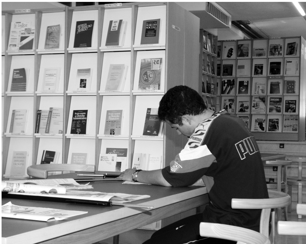
Biblioteca General del Campus de Cuenca. Hemeroteca.

General de Cuenca, y que asciende a 65.975 ejemplares.