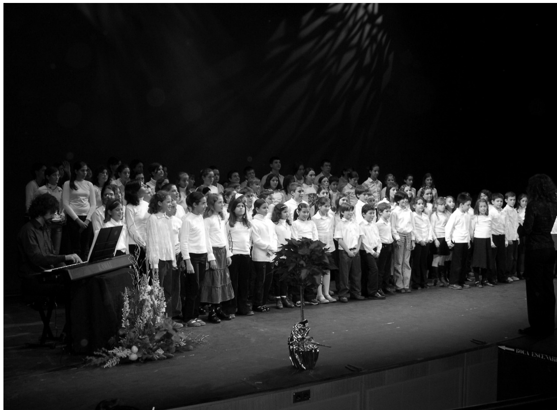
Concierto de Navidad 2004.

En el actual curso 2005-06 el proyecto aborda un nuevo reto motivado por la búsqueda de una mayor eficiencia en el trabajo que se está haciendo, ofertar una mejor calidad de enseñanza y mejores resultados; es un paso importantísimo en la evolución de “Aula Coral”. Motivado entre otras cosas por el intercambio con el coro de Valencia y por el conocimiento del funcionamiento de otros proyectos corales similares al nuestro en otras ciudades de España, se opta por el agrupamiento (esto quiere decir que en lugar de mantener tantos coros, a veces con un número de componentes desigual) en todos esos colegios, ahora todos los niños de Albacete interesados en participar en “Aula Coral” asisten a un único centro en el que se concentra todo el trabajo, concretamente el Colegio Público Reina Sofía. Esto supone la verdadera creación de una