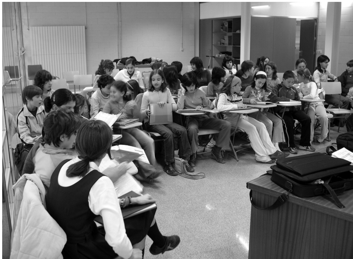
Coro juvenil ensayando en el CP Reina Sofía.

Periódicamente (normalmente al finalizar cada trimestre), se organiza un concierto en el que se muestra el trabajo realizado en él (además de estos 3 coros se unen el resto de agrupaciones vinculadas al proyecto). Todos los niños que participan en el concierto suelen cantar una obra común previamente decidida y ensayada en los respectivos coros.