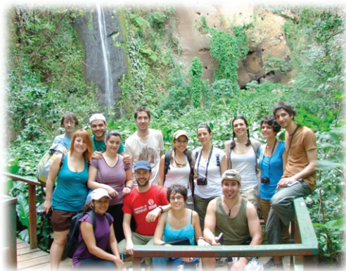
Figura 3. Participantes en el programa de una de las brigadas.

Las entrevistas se realizaron con cuatro de los participantes en la octava brigada del programa JVCAL, un día antes de regresar de Nicaragua. Se optó por una entrevista no estructurada, con preguntas de tipo abierto, mediante las que se les solicitó que expresaran sus impresiones sobre la experiencia vivida y formularan apreciaciones sobre la repercusión en sus vidas: ¿cuáles eran las expectativas que tenías antes de llegar a Nicaragua?; ¿qué crees que has aprendido?; ¿cuáles son tus sensaciones después de la experiencia?; ¿te ha servido para algo?; ¿qué es lo que más te ha impactado?; ¿por qué?.