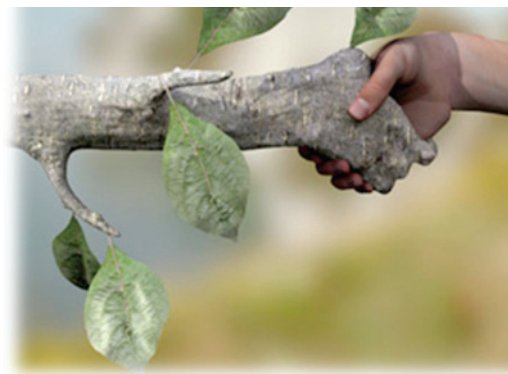
Figura 2. Metáfora sobre la protección del Medio Ambiente.

propios conceptos, buscando que los participantes se conviertan en agentes activos para la sensibilización de toda la ciudadanía. De hecho, además de constituir un compromiso solidario con la sociedad, el paso de los participantes por este programa de Voluntariado se constituye como una importante herramienta para la Educación Ambiental. Así, a través de su implicación directa en la conservación de los recursos naturales y la mejora de la calidad ambiental, los voluntarios adquieren actitudes y comportamientos proambientales.