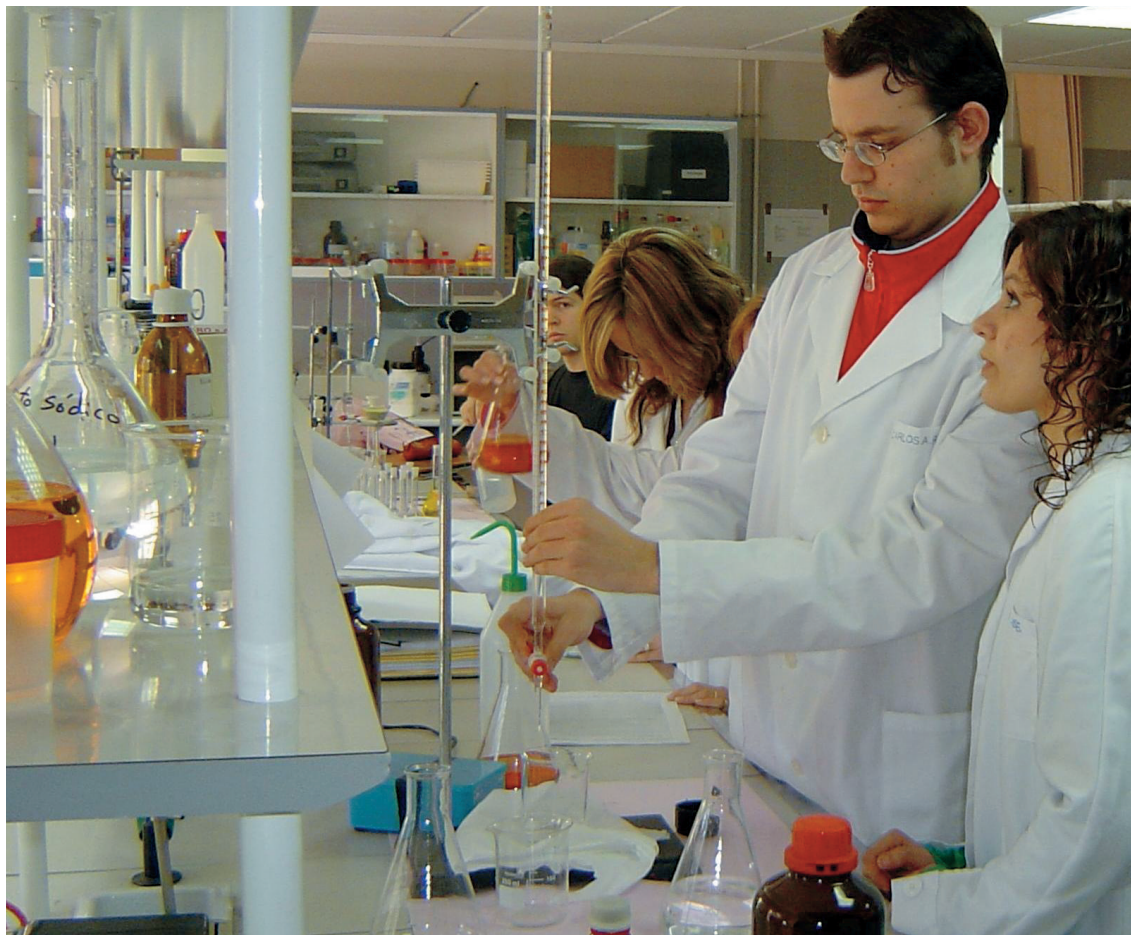
Alumnos de CGS de Química en el IES Andrés de Vandelvira, Albacete.

cia laboral, en definitiva, entre la formación laboral y la Formación Profesional. La cualificación de las personas a lo largo de su vida es la pieza instrumental para que nuestro sistema educativo y de formación cumpla su cometido. Por tanto, siempre en ese marco de flexibilidad, las personas con polivalencia y capacidad serán mucho más útiles a nuestra sociedad. El nuevo escenario descrito, ha llevado a una serie de profundas reformas en la Formación Profesional, materializadas en nuestro País con la Ley Orgánica 5/2002, de 19 de junio, de las Cualificaciones y de la Formación Profesional, que como ya establece en su preámbulo, tiene como objetivo prioritario “facilitar la integración de las distintas formas de certifica-