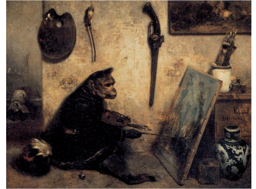
Decamps, Alexandre Gabriel: The Monkey Painter , 1833.