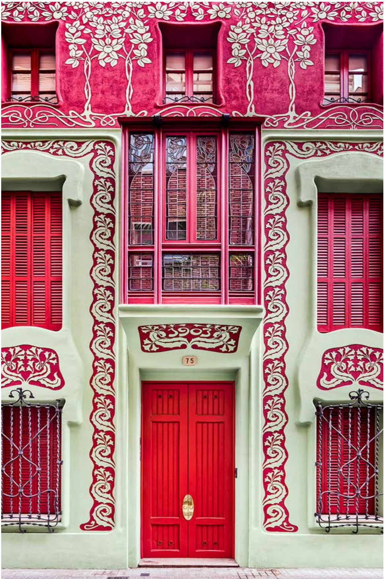
Jeroni Granell i Manresa. Casa Unifamiliar, 1903. (Barcelona). (Detalle).