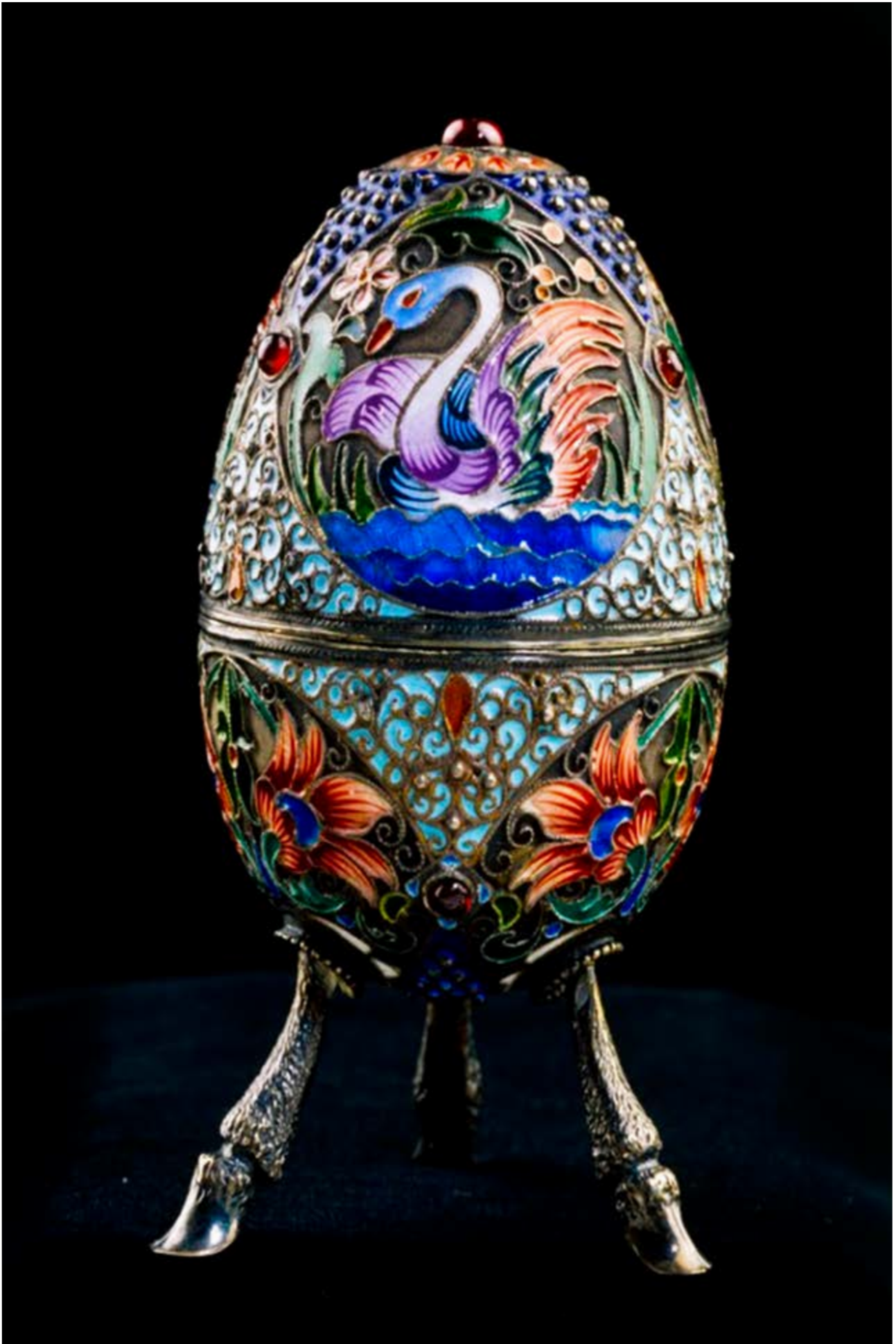
Gregory Sbitnev. Huevo decorativo, Moscú, (1908). Museo Art Nouveau y Art Decó Casa Lis, (Salamanca).