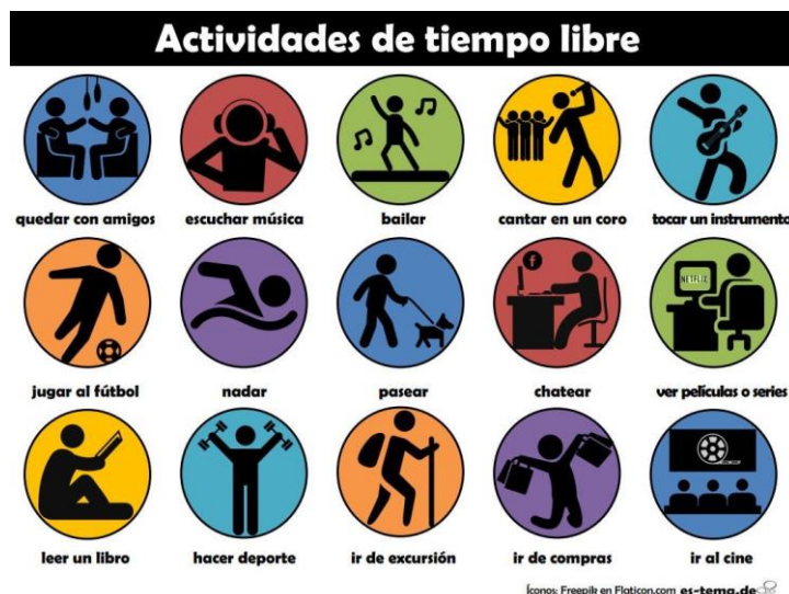
Imagen 1. Diferentes tipos de actividades de ocio y tiempo libre clásicas. 3

Diversos estudios hacen notoria la necesidad de un cambio en los hábitos de los escolares que han ido modificándose y acercándose más al sedentarismo y la mala alimentación en los últimos años 4 . Desde la enfermería siempre se fomentan hábitos saludables para toda la población aunque son especialmente importantes en la edad infantil ya que es cuando se fijan los mismos por lo que las acciones llevadas a cabo en estas edades servirán para el resto de la vida 5 .