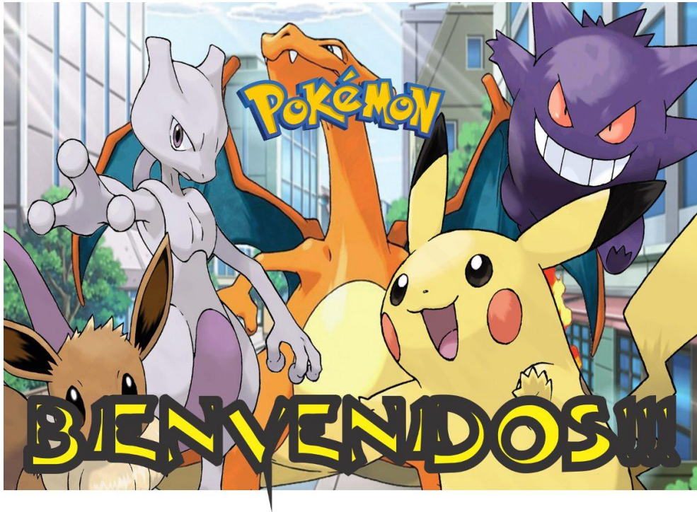
Imagen 5. Póster Publicitario Pokemon.

Se elabora un cartel de acogida a los participantes en las actividades del programa de EpS que se colocará a la entrada del patio del colegio Pedro I de Tordesillas.