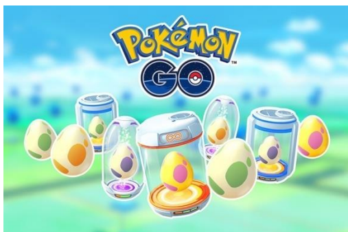
Imagen 2. Huevos de Pokemon.

hábitos, si les conocen y si les realizan en su vida. Se hace especial hincapié en el ejercicio físico y en el consumo de agua para que incrementen estos hábitos saludables en su tiempo libre.