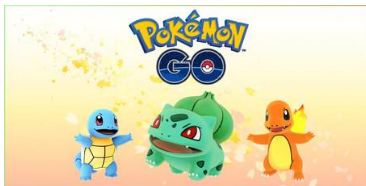
Imagen 3. Poster animado de la segunda sesión. Fuente: Common Sense Media 2016 10

Una vez hecho esto les pediremos que se pongan en marcha y por el patio del colegio donde se realiza la sesión deberán encontrar frutas y verduras a tamaño real que el equipo organizador habrá escondido previamente. Cada fruta y verdura llevará un lazo del color del pokemon que aparece en el poster (azul, verde o naranja). Una vez hayan encontrado todas las frutas y verduras que estaban desperdigadas por el patio de procederá a que cada niño salga al centro y explique al resto el nombre de la pieza, cada cuanto se come en su casa y si le gusta, por supuesto los miembros del equipo de trabajo les echaremos una mano y ayudaremos en todo momento. Para finalizar les explicaremos mediante nuestro poster animado que le gusta a cada pokemon comer, de ahí los lazos de colores, e intentaremos que conozcan algunos hábitos de vida saludable relacionados con frutas, verduras y ejercicio, el cual han estado llevando a cabo durante la gymkana.