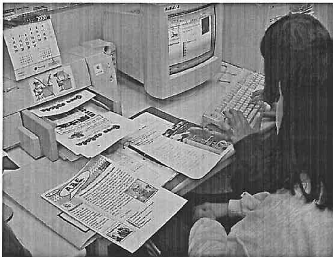
Editando el Periódico

C u a n d o todo el profesorado va aprendiendo a resituar sus previos, se va creando un estilo de intervención y es cuando descubrimos la fuerza del equipo y el privilegio de nuestra profesión.