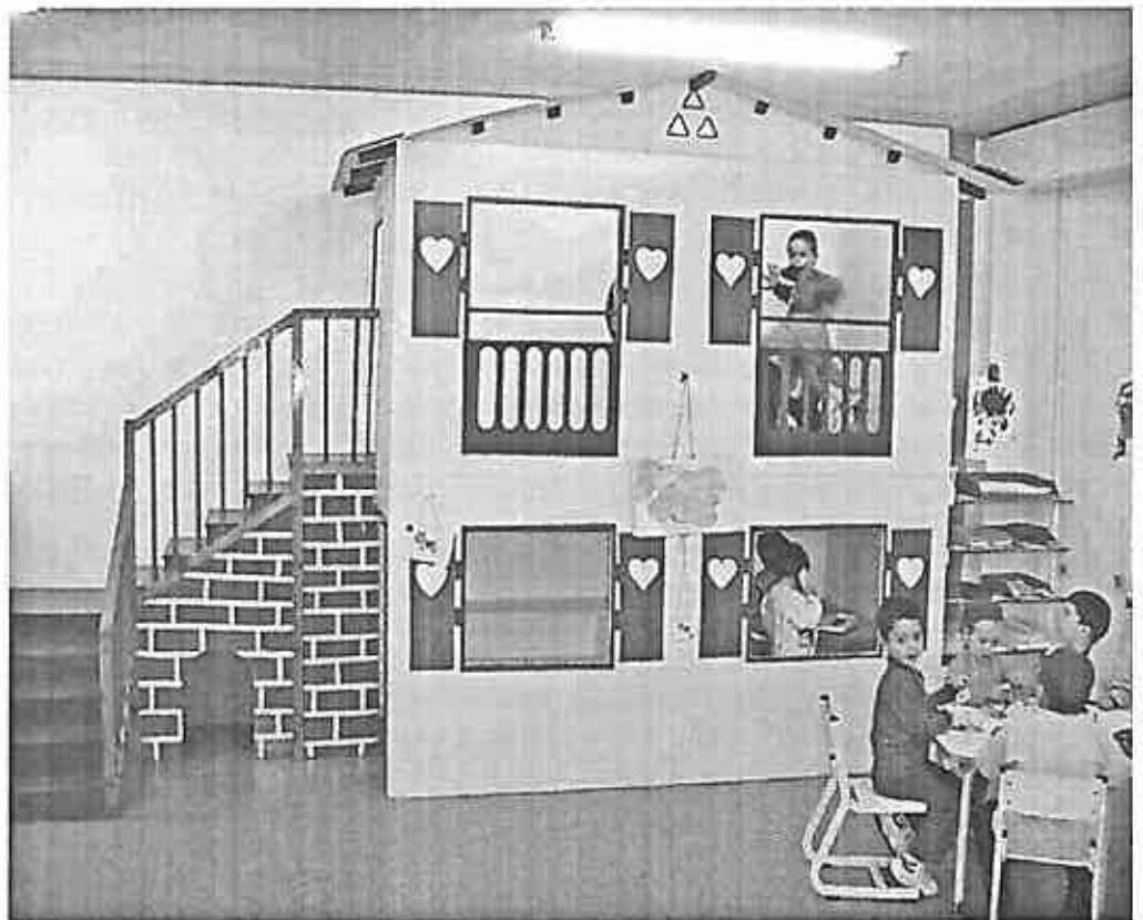
Tienda (5 años)

Es un privilegio ser maestro y entrar cada mañana a esa gran universidad que es la escuela, con todos los sentidos abiertos para poder captar y aprender de esas criaturas y de nuestros compañeros.