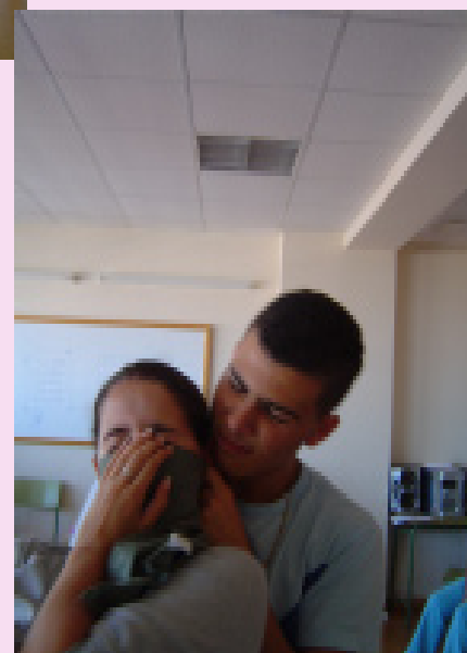
Uno de los talleres realizados en el centro