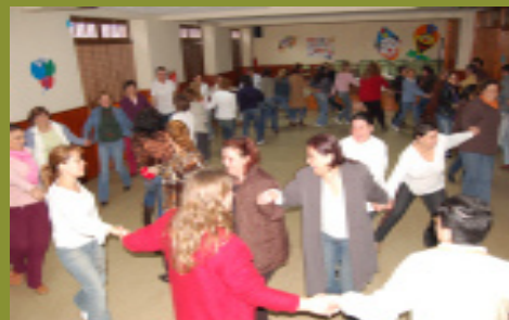
Momentos de uno de los talleres de convivencia familias/profesorado celebrados en el centro a lo largo de este curso.