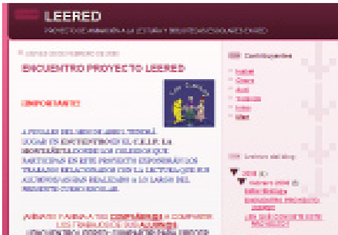
Portada del blog creado y mantenido por las coordinadoras del Proyecto en red Leered.