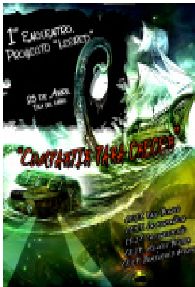
Cartel anunciador del I Encuentro de los centros participantes en el Proyecto, el pasado 25 de abril.

Aunque compartimos actividades concretas a realizar con títulos concretos, nos hemos encontrado con dificultades para elaborar el Plan Lector. Compartimos criterios, pero unificar objetivos, títulos, metodología,... es difícil de conseguir en tan poco tiempo.