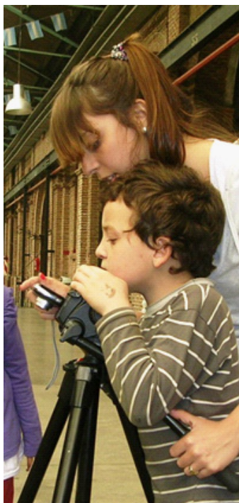
Figura 3. Un niño realiza una toma fotográfica con la guía de una estudiante. Proyecto Animate a animar. UNLa.

Los programas y proyectos comparten algunos propósitos generales tales como la formación de espectadores y la realización de piezas audiovisuales. Pero al analizar sus objetivos con detenimiento, es posible reconocer importantes diferencias que se vinculan con la perspectiva acerca de lo audiovisual que asume cada propuesta. Los objetivos se enuncian en estrecha relación con los contenidos y en este sentido se distinguen tres tipos: a) Abordan los medios de comunicación. Los niños/as “producen” con el propósito de analizar críticamente, defensivamente. El fin es la alfabetización medial/audiovisual. b) Abordan el cine desde una perspectiva cultural y artística. Los niños/as “crean” para encontrarse con la historia social, con la alteridad, con lo diverso. Crean para expresarse, para disfrutar, para conocer al otro y a sí mismos. c) Abordan el cine y la creación audiovisual como una vía “para”. Los niños/as (en colaboración con jóvenes) realizan audiovisuales para incluir a grupos sociales desfavorecidos (vulnerados), para democratizar saberes, para ejercer un derecho, para cooperar entre comunidades/ instituciones/naciones.