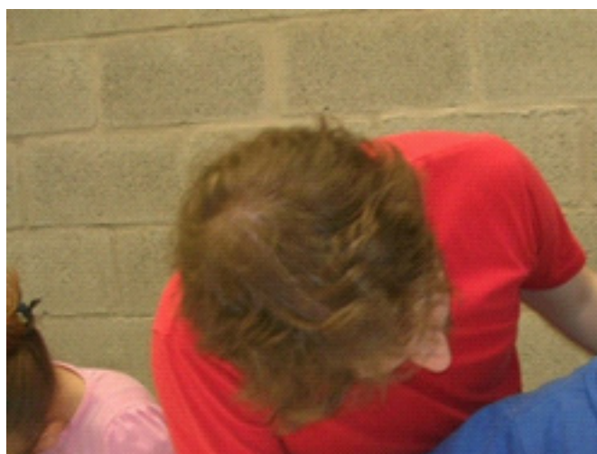
Figura 2. Un estudiante universitario de la Carrera de Audiovisión ayuda a un niño a diseñar un personaje. Proyecto Animate a animar. UNLa.

Varios proyectos se implementan con niños y niñas desde los 4 años de edad, pero la mayoría están destinadas a escolares entre 6 y 12 años. En las propuestas que se realizan en colaboración con universidades los destinatarios son dos poblaciones simultáneamente, los estudiantes de universidad y los escolares; los jóvenes son capacitados para trabajar con niños/as. Por su parte, los festivales invitan a asistir al público infantil y a sus acompañantes sin limitación de edad. Para la presentación de obras en competición se consideran “niños y jóvenes” a los realizadores/ as hasta los 18 años de edad.