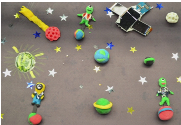
Figura 5. Fotograma del corto de animación "El fin del Universo". Animación de arte plano, personajes y elementos modelados en masa, lentejuelas y objetos construidos en cartón. Autoras: niñas de 8 años. Animate a animar.