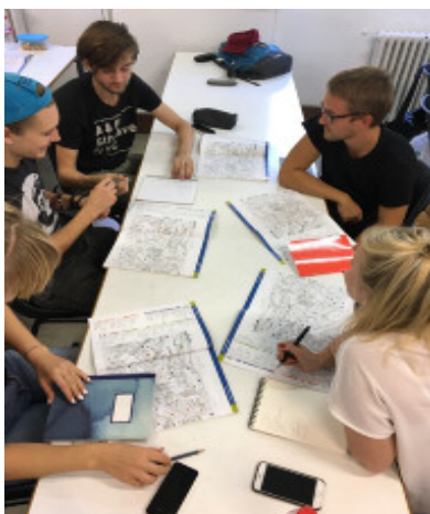
Foto 1. Escogemos el vocabulario

Para esta actividad, primero formamos grupos de cinco o seis estudiantes y trabajamos con el vocabulario, por ejemplo, en este caso, sobre la unidad introductoria que versa sobre la ciudad (ver anexo 1). Por grupos, los estudiantes deben escoger aquellas palabras en las que estén de acuerdo que les cuesta pronunciar.