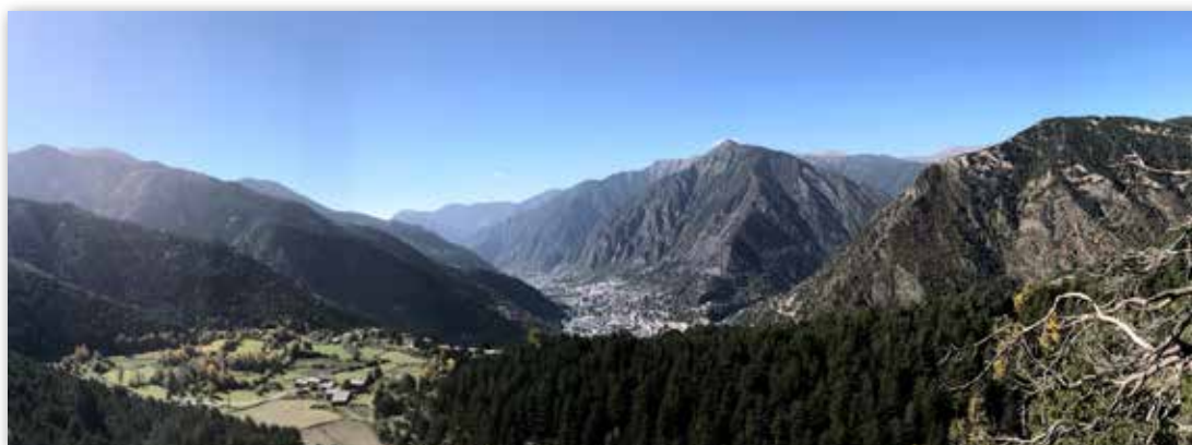
Vista de Andorra la Vella y Escaldes desde el Mirador de Engolasters

El resto de datos procede de la Oficina de Información Diplomática del MAEC ( http://www.exteriores.gob.es/Documents/FichasPais/ANDORRA_FICHA%20PAIS.pdf ).