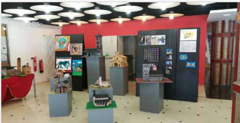
Exposición Andorra País Románico del Colegio Español María Moliner, un ejemplo del proyecto artístico del centro

En el centro se desarrollan los siguientes proyectos: lingüístico, artístico, deportivo y científico-tecnológico, además de ser escuela UNESCO y de participar en las iniciativas Escola Verda y Jove Voluntariat Lector, que fomentan respectivamente el ecologismo y el voluntariado, colaborando con la sociedad andorrana a través de la lectura en varios idiomas. Las actividades complementarias y extraescolares son variadas y abarcan además de la organización del Concurso Literario Sant Jordi y de la Olimpiada de matemáticas del Principado de Andorra, las actuaciones de un coro y un grupo de teatro, participación en jornadas culturales, científicas y de las humanidades; actividades deportivas como el esquí escolar, patinaje o natación; intercambios escolares, el viaje del Camino de Santiago y los viajes culturales de fin de curso.