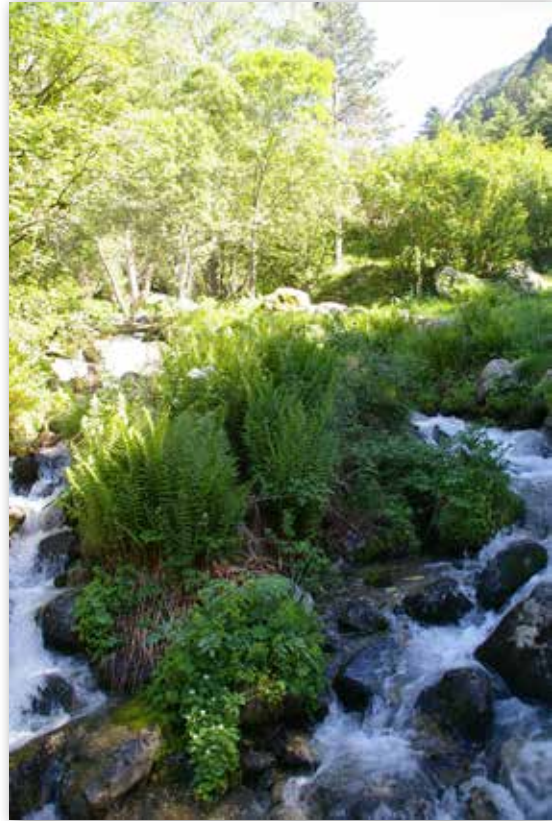
El itinerario de Entremesaigües se encuentra en el valle del Madriu-Perafita-Claror, declarado Patrimonio de la Humanidad por la UNESCO en la categoría de paisaje cultural