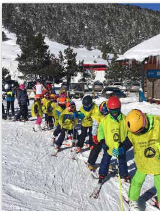
Los alumnos de los tres sistemas educativos en Andorra disfrutan de jornadas de esquí escolar

Los tres centros confesionales son centros en los que funciona el sistema educativo español pero que están subvencionados por el Gobierno de Andorra y que ofrecen enseñanza gratuita al igual que el CEMM. La lengua vehicular es el catalán. En cualquier caso, todos los estudiantes del SEE español deben poder expresarse en lengua española a un nivel mínimo B2 del MCERL en las cuatro destrezas comunicativas al terminar el Bachillerato.