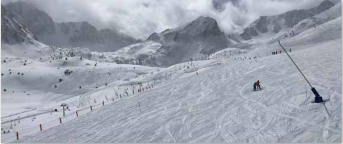
Andorra cuenta con la superficie esquiable más grande de los Pirineos, con más de 300 kms. de pistas

El Principado de Andorra cuenta con un clima de tipo montañoso Mediterráneo, con un invierno frío con importantes nevadas, y un verano caluroso aunque se producen algunas variaciones dependiendo principalmente de la latitud. Goza de un gran número de días soleados al año y un clima seco, con una media mínima anual es de -2^{\circ}\text{C} , y una máxima de 24^{\circ}\text{C} . En cuanto a las precipitaciones, éstas suelen ser en forma de lluvia entre los meses de octubre y mayo, con nevadas en invierno.