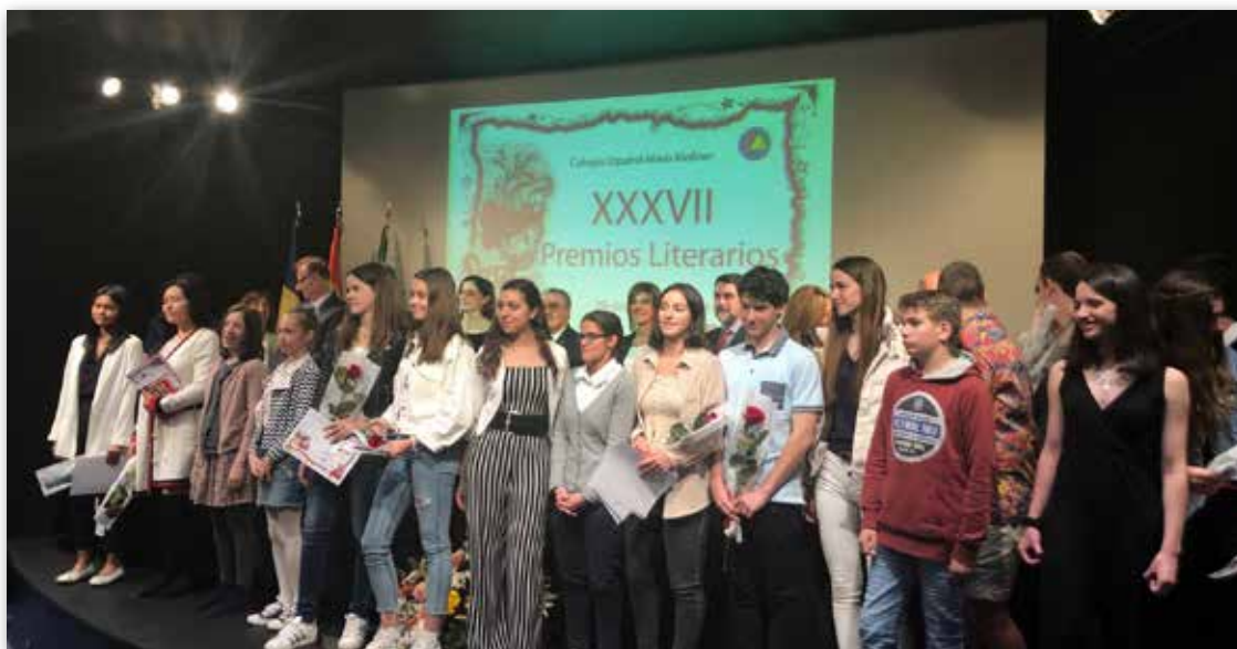
Ceremonia de entrega de premios del XXXVII Concurso Literario Sant Jordi

La Consejería de Educación, en el ámbito de sus competencias y en un clima de colaboración con las instituciones educativas y culturales del país, promueve la presencia cultural española en Andorra. Para ello, colabora con la Embajada de España en la organización de conferencias y exposiciones y estimula las iniciativas culturales del Colegio Español María Moliner, prestando su ayuda en la organización de concursos, jornadas culturales y otras actividades de difusión y promoción de la lengua y la cultura española entre la sociedad andorrana.