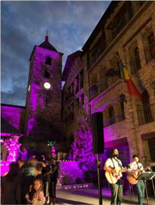
Actuación musical en la Nit de la Candela de Ordino