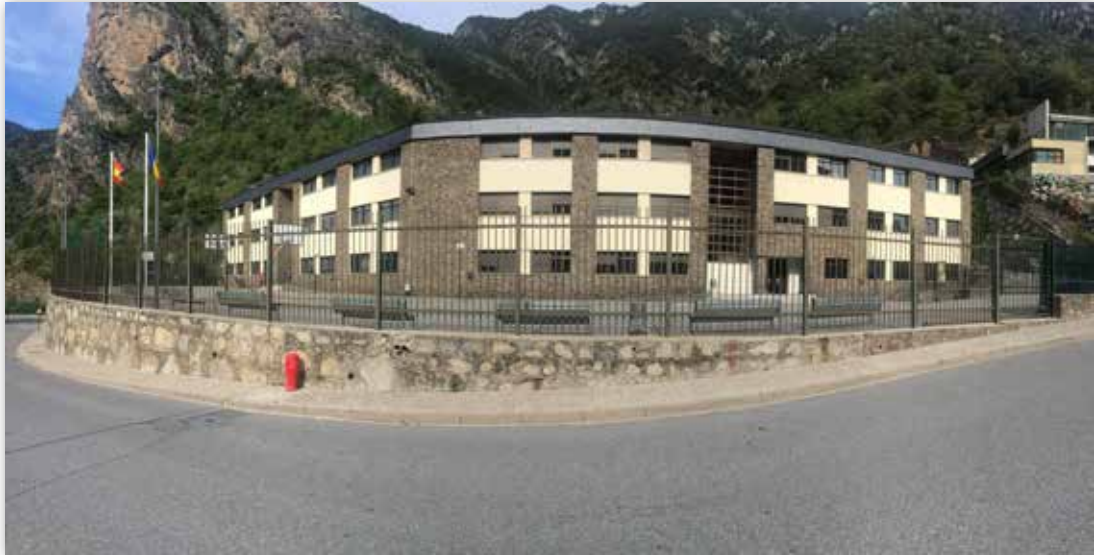
Fachada del Colegio Español María Moliner

En estos centros se imparten enseñanzas regladas del sistema educativo español de nivel no universitario, dirigidas tanto a españoles como extranjeros, y adecuándolas a las necesidades específicas del alumnado y a las exigencias del entorno socio-cultural.