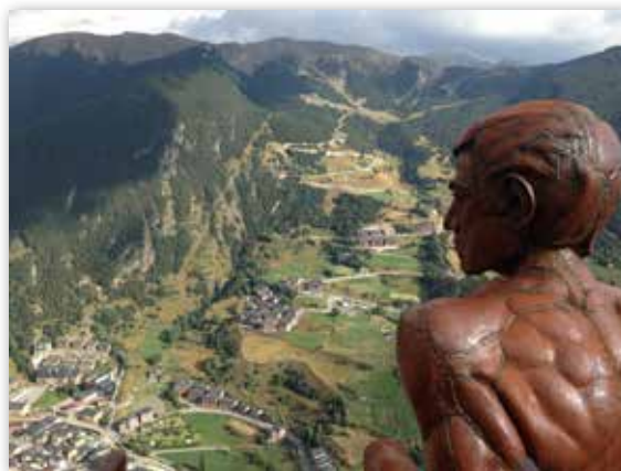
Canillo desde el Mirador del Roc del Quer