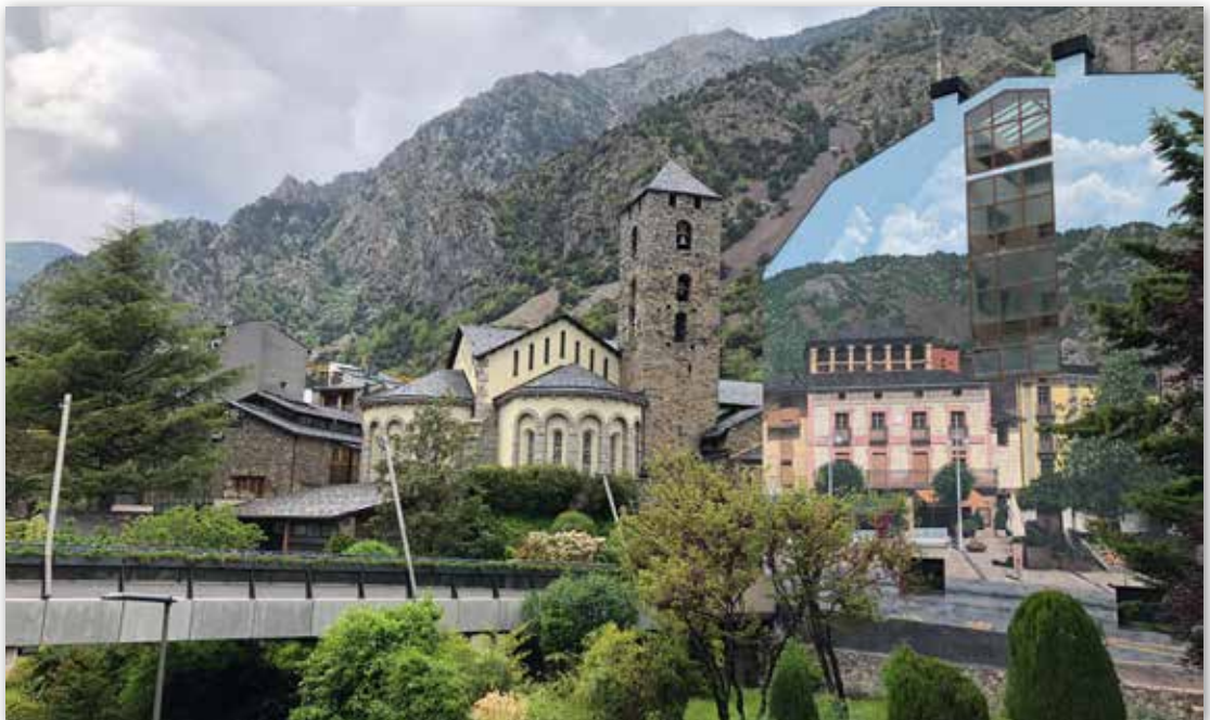
Plaza de Sant Esteve de Andorra la Vella, capital del país

El Principado de Andorra es un coprincipado parlamentario, siendo el único país del mundo que cuenta con dos jefes de estado. Los Coprincipes del Principado de Andorra son el obispo de Urgell y el presidente de la República Francesa.