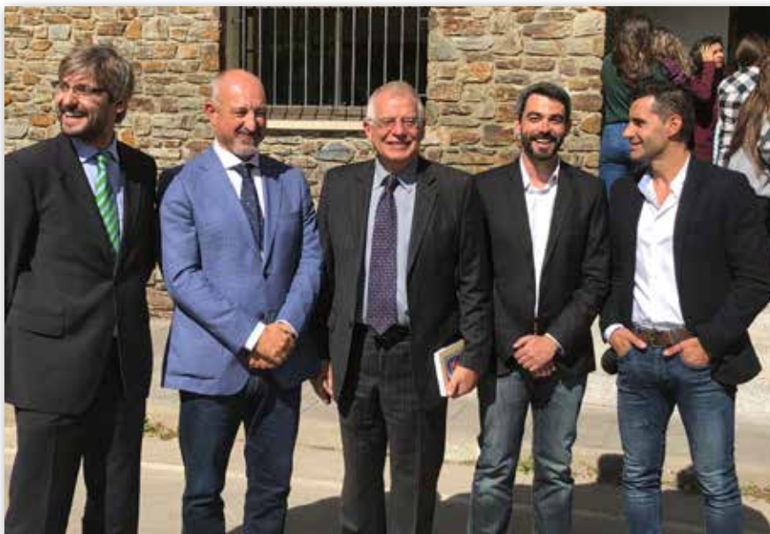
El Ministro Josep Borrell junto a miembros del equipo directivo en la sede de secundaria del Colegio Español María Moliner.