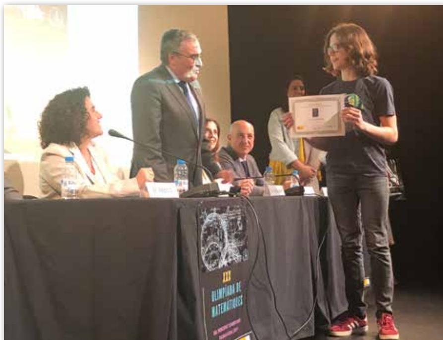
El Embajador hace entrega del premio al ganador de la Olimpiada de Matemáticas del Principado de Andorra 2019