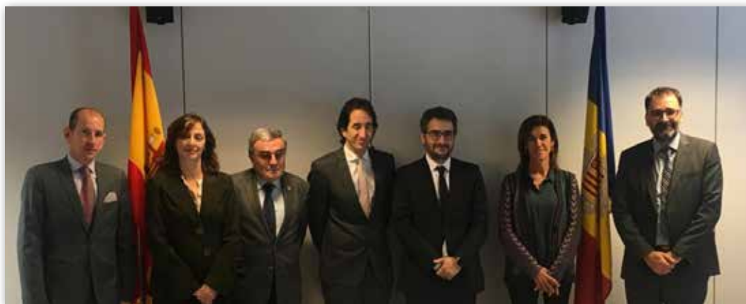
Reunión de la comisión mixta hispano-andorrana en materia de educación en 2018

Si escogen el Sistema Educativo Español (SEE), pueden elegir entre el centro integrado de titularidad del estado español María Moliner, tres colegios congregacionales y un centro privado laico.