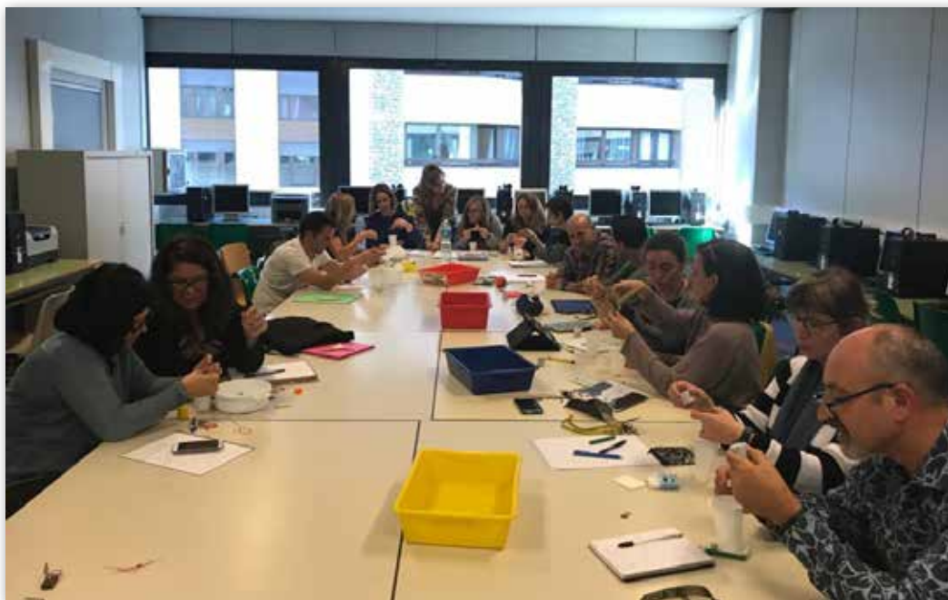
Curso de formación para profesores del sistema educativo español en Andorra en la sede de infantil y primaria del Colegio Español María Moliner

También promueve la formación de examinadores DELE ya que la Consejería de Educación es Centro Examinador DELE del Instituto Cervantes, siendo el Colegio Español María Moliner el centro donde se realizan estos exámenes dos veces al año con la colaboración de los miembros del profesorado que cuentan con el certificado que los acredita como examinadores DELE.