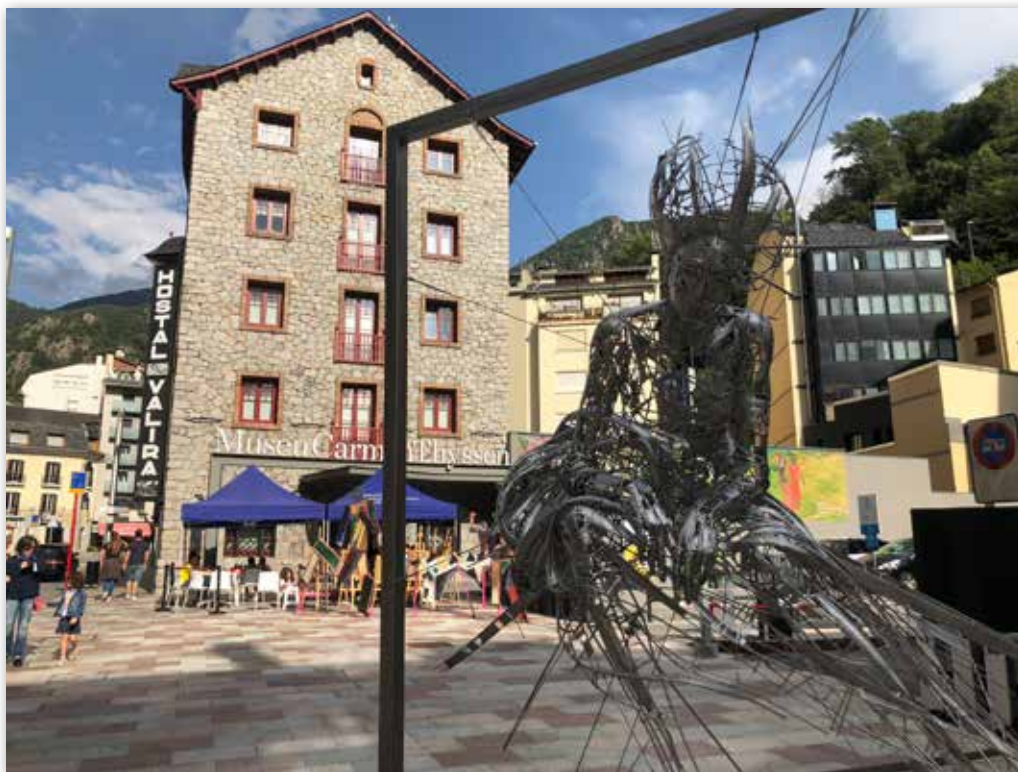
En 2019, una de las actividades del Nova Aula Oberta se ha realizado en el Museo Carmen Thyssen Andorra

En cuanto a jornadas culturales, además de las jornadas que organiza el Colegio Español María Moliner para su alumnado, este centro educativo organiza con la colaboración de la Consejería de Educación Tertulias Dialógicas y participa en las conferencias de Nova Aula Oberta, organizadas por la Consejería, aportando ponentes.