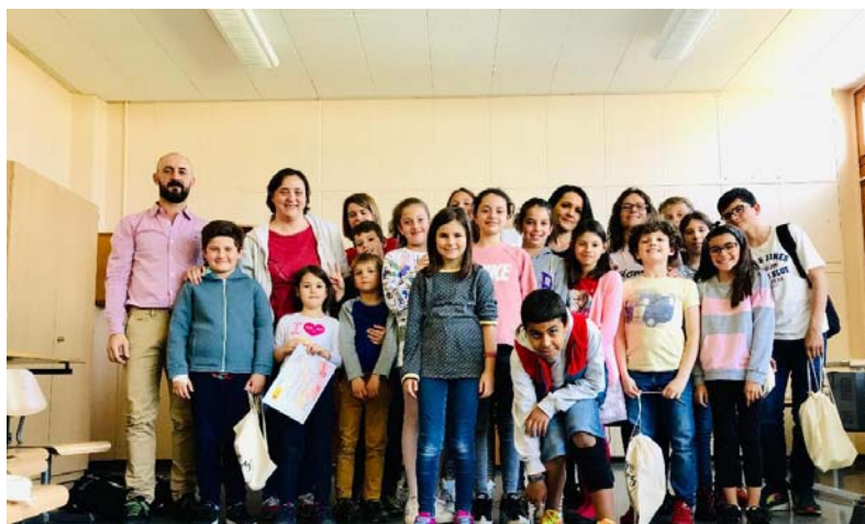
II Jornada suiza de lectura en voz alta. Programa “La magia de la voz” de la Consejería de Educación en Berna en la Agrupación de Lengua y Cultura de Lausana. Mayo de 2019. Aula de Écublens (Vaud)

En el Ticino, desde el nivel preescolar, la actividad semanal es de cinco días, de lunes a viernes, con una tarde libre el miércoles. En una parte importante de las escuelas hay jornada continua.