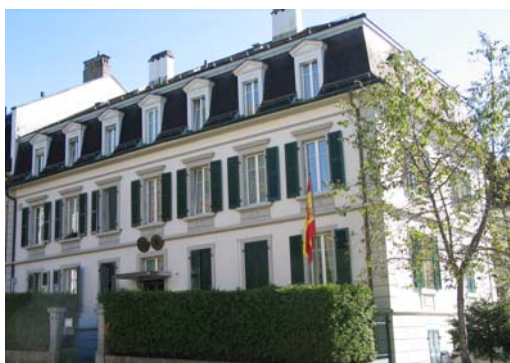
La Consejería de Educación de la Embajada de España

https://www.eda.admin.ch/aboutswitzerland/es/home.html