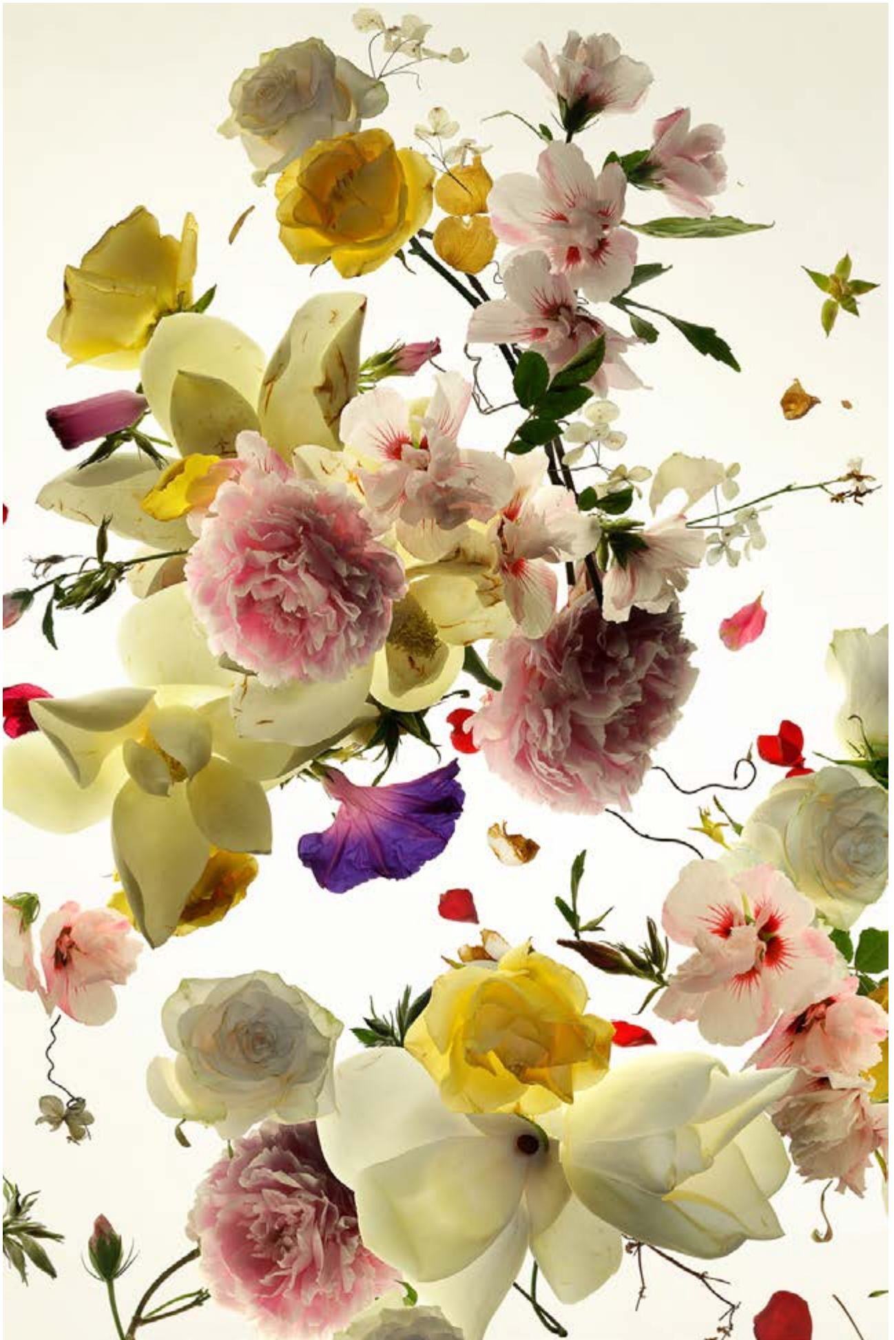
Gómez-Chao, Xurxo (2017). Tratado de botánica aplicada. (Detalle). Madrid: Galería BAT.