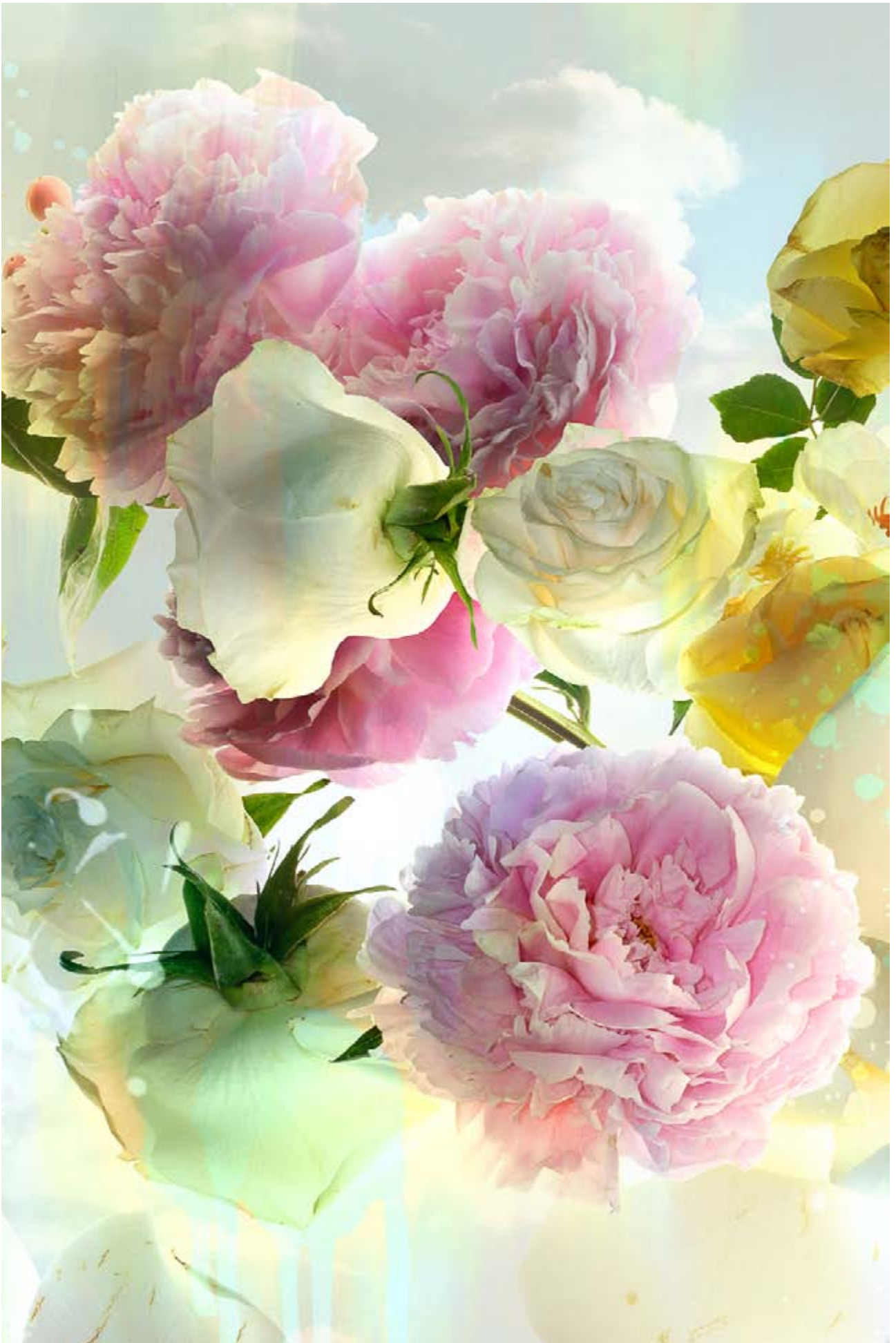
Gómez-Chao, Xurxo. (2017). Bouquet n.º XIX. (Detalle). Madrid: Galería BAT.