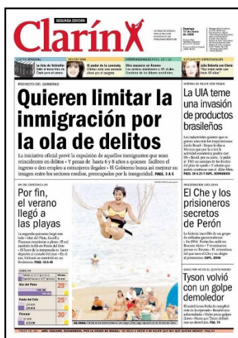
Figura 4. Diario “Clarín” del 17/01/1999. Utilizada en el cuestionario construido para esta investigación

Del análisis se desprende que los y las estudiantes están en desacuerdo con el tratamiento de un tema socialmente controvertidos, sobre la base de algo que no les es claro y sobre el desconocimiento de si se están brindando datos reales, son claros indicios de un pensamiento crítico que hay que acompañar para que se nutra de conceptos e información en la toma de posicionamiento. Podemos ver así las dificultades que presenta la utilización de un medio de comunicación como recurso, cuya finalidad subyacente pretendía ser el discernimiento sobre la intencionalidad de los mensajes que se construyen sobre una realidad. El punto de partida debería ser la comprensión de que “si partimos de que la objetividad no existe, tenemos que reconocer con los y las estudiantes la subjetividad del mensaje y hacerlo objeto de análisis crítico” (Dobaño Fernández y otros, p. 29, 2000).