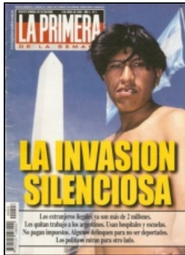
Figura 3. Revista “La primera de la Semana”. Utilizada en el cuestionario construido para esta investigación

3) y la otra de un tradicional diario argentino: “Clarín” del 17/01/1999 (Figura 4), ambos en formato digital y de consulta masiva.