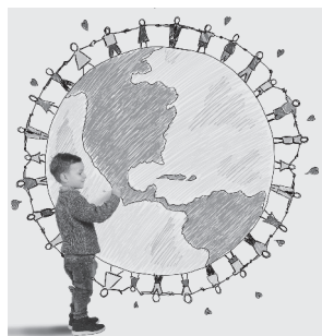
Gráfico: La investigación-acción para la paz

La construcción de cultura de paz se plantea, entonces, desde un ejercicio vinculado a la investigación (pedagogía) y a la acción (educación).