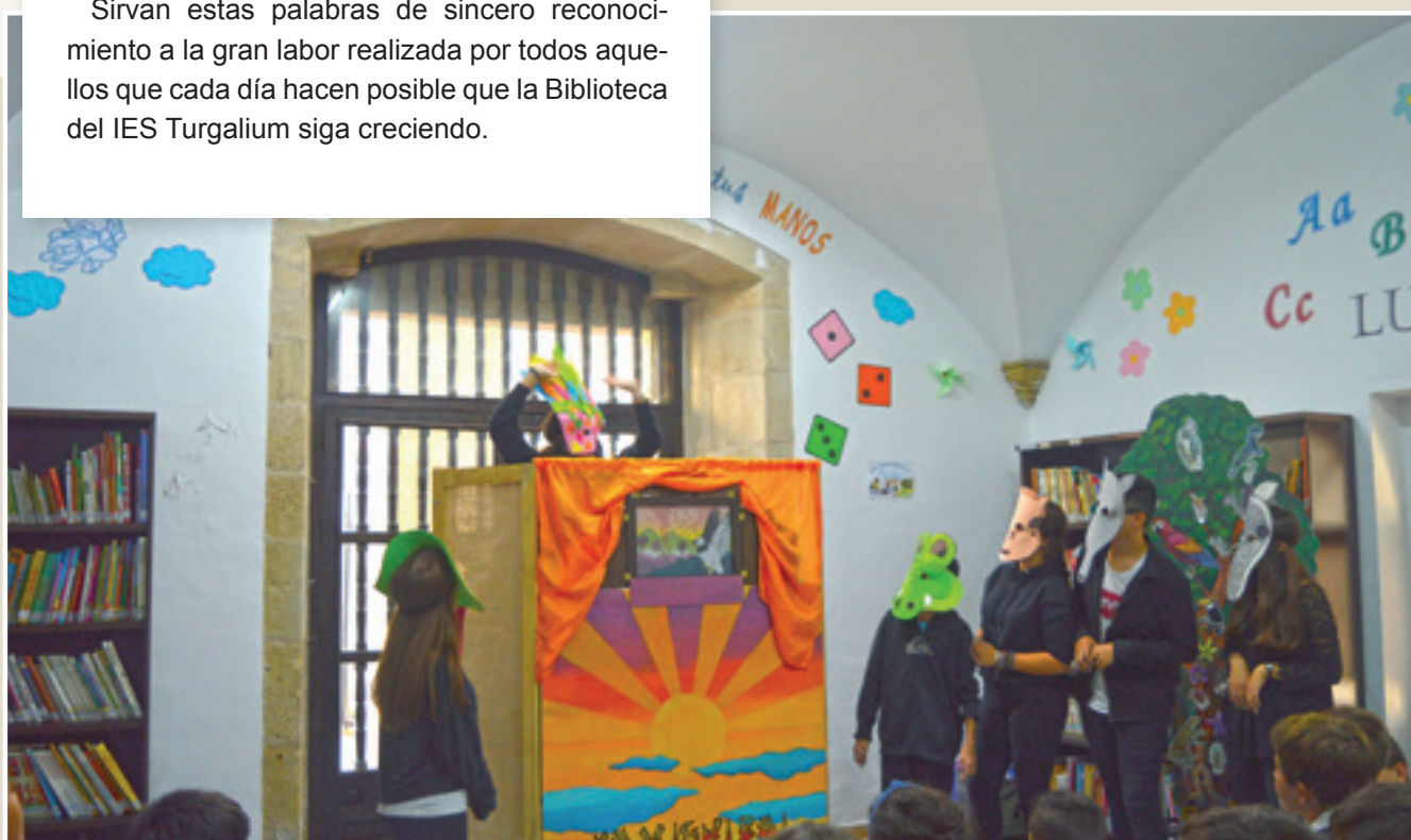
■ Imagen 6: Ludoteca

http://bibliotecaiesturgalium.blogspot.com/2018/06/la-biblioteca-presenta-un-anomas-su_15.html