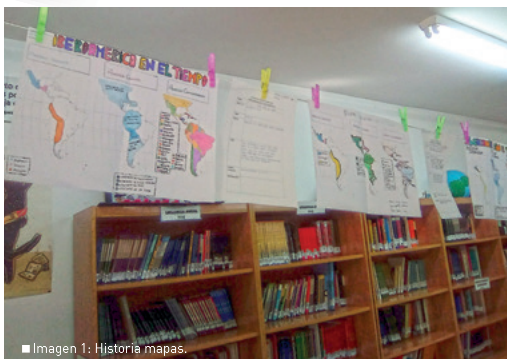
■ Imagen 1: Historia mapas.

Descubriendo un nuevo mundo: Proyectos interdisciplinares y animación a la lectura en el IES Turgalium”