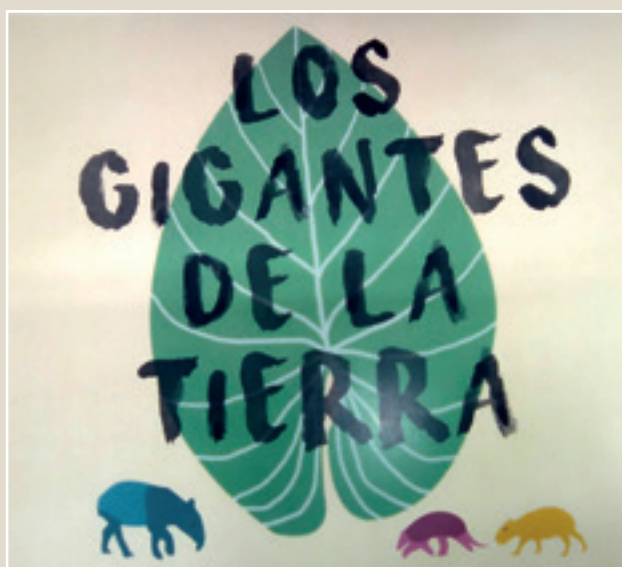
■ Imagen 7: Portada

En el proyecto documental inicial, los alumnos de Diversificación tenían que investigar los orígenes y características del llamado “teatro de papel” para posteriormente, construir un butai y contar cuentos en la biblioteca a sus compañeros de otros cursos. Tras la lectura de los cuentos, se llevaba a cabo un debate centrado en la educación en valores como la