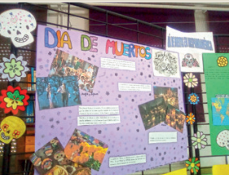
■ Imagen 2: Lengua. Día de muertos.

Animación a la lectura, Investigación, Biblioteca, Proyecto interdisciplinar, América, Kamishibai