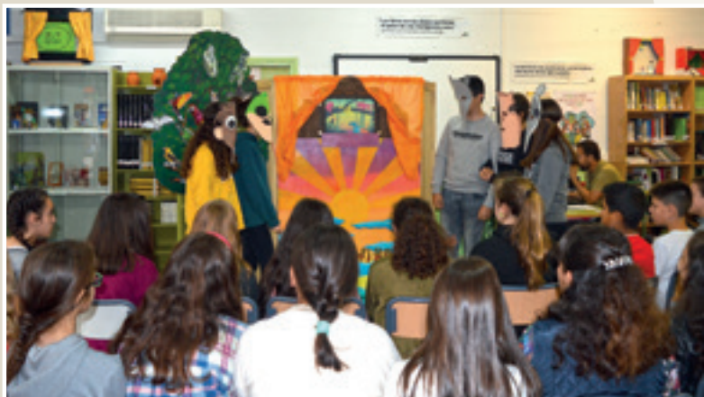
■ Imagen 8: Biblioteca. Gigantes.