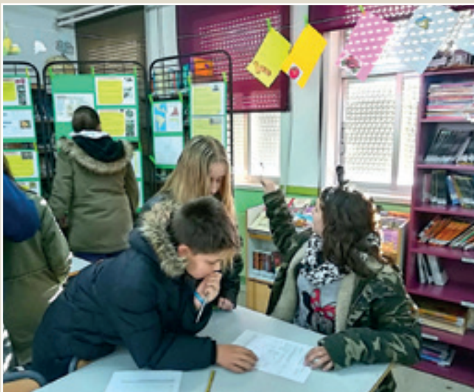
■ Imagen 5: Recursos naturales.

Departamento de Ciencias Naturales: “ Recursos naturales provenientes del Nuevo Mundo ”. Los alumnos de 1 o de ESO fueron los protagonistas de este proyecto de investigación, elaborando varios paneles informativos que tuvieron como finalidad dar a conocer la repercusión del Descubrimiento de América en la economía española y presentar el estudio de los distintos recursos naturales que se importaron desde el Nuevo Mundo. Los demás grupos de alumnos del centro pudieron participar también en esta actividad a través de fichas de recabado de información con preguntas sobre los contenidos presentados en los distintos paneles. (Foto 5)