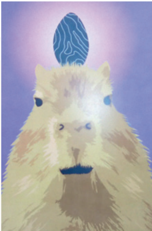
■ Imagen 6: Lámina.