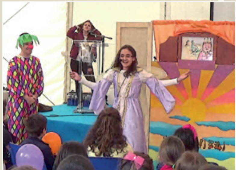
■ Imagen 6: Feria del Libro