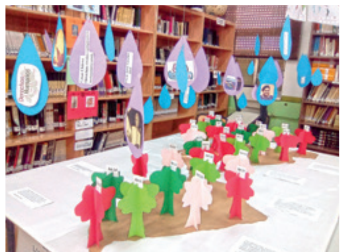
■ Imagen 4: Economía