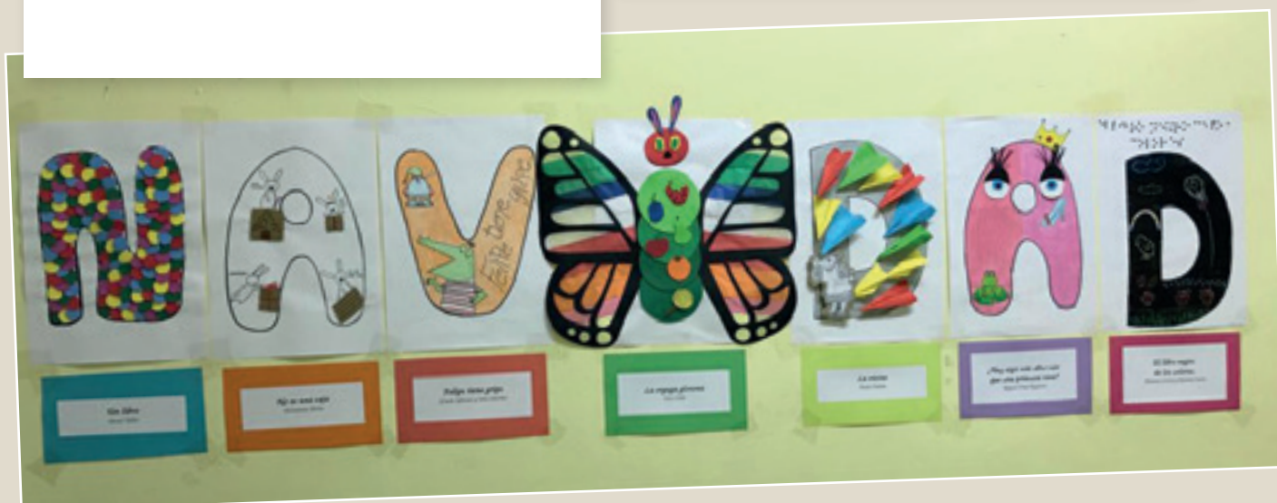
■ Foto 4. Letras decoradas con los cuentos elegidos para el proyecto “Escuela de Cuentos”.

■ De manera conjunta se hicieron múltiples actividades, todas ellas enfocadas bajo la metodología aprendizaje servicio, como fueron la decoración navideña basada en los álbumes ilustrados elegidos que formaban cada letra de las palabras FELIZ NAVIDAD, la colaboración con entidades educativas y sociales de Moraleja en la preparación y ejecución de sesiones educativas y cuentacuentos basados en varios cuentos o álbumes ilustrados ( La oruga glotona , No es una caja , Monstruo Rosa , Pequeños detectives de monstruos , etc.). Así como nuestra actividad estrella, el Espacio en Verde , donde decoramos nuestro centro en tonos verdes para desarrollar una tarde dos sesiones de Cuentacuentos para niños/as de 3-6 años y un Bebecuentos para niños/as de 9 meses a 3 años. Foto 4.