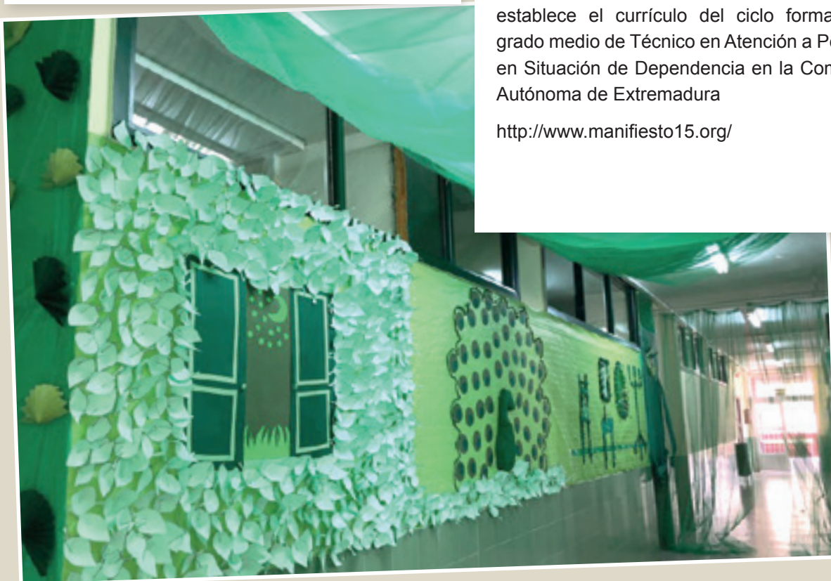
■ Foto 5. Espacio en Verde. Pasillo del IES Jálama 2.