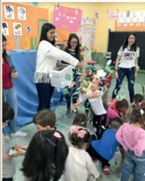
■ Foto 3. Actividad inspirada en el álbum ilustrado "Monstruo Rosa" de Olga de Dios, realizada en El "Joaquín Ballesteros" de Moraleja.

Algunas de las actividades que fueron surgiendo a lo largo del proyecto se llevaron a cabo con otras instituciones, tanto sociales, como educativas para las que se requirió la colaboración con otros profesionales. Con el Ayuntamiento de Moraleja se colaboró en actividades puntuales como la Semana Cultural de Moraleja y específicamente con la organización del Día del Libro y la Convivencia Intercentros.