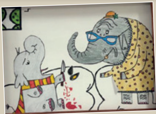
■ Foto 1. Kamishibai “Felipe tiene hepatitis B” basado en el cuento “Felipe tiene gripe”

■ Promover la cultura y la formación integral en nuestro entorno cercano a través de actividades de servicio a la comunidad que proporcionen además un aprendizaje real y práctico en nuestro alumnado, adaptándonos a las características