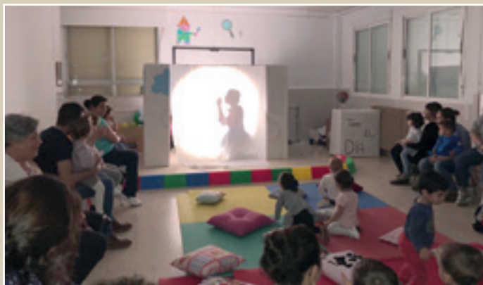
■ Foto 2. Momento del Bebecuentos realizado por las alumnas del Ciclo Formativo de Grado Superior en Educación Infantil.

Realizada durante el curso anterior y planteada debido a las necesidades observadas en cursos anteriores. Se hizo un análisis de todos los trabajos realizados por el alumnado del Ciclo Formativo de Grado Superior en Educación Infantil que tuvieran relación con cuentos o literatura infantil. También se analizaron portadas de trabajos o logotipos insertos en la distinta documentación generada.