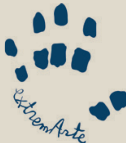
■ Imágenes 2, 3 y 4

Autónoma en todos los niveles (artístico, ambiental, geográfico, deportivo, literario, histórico, etc.). Consideramos que desde los centros educativos tenemos la responsabilidad de transmitir el valor que tiene nuestra tierra. Un valor que no siempre se ha reconocido para Extremadura, por esta razón queríamos que, al menos nuestros alumnos, nunca duden de ese valor y de esa fuerza que emana de los cielos y de la tierra a la que pertenecemos.