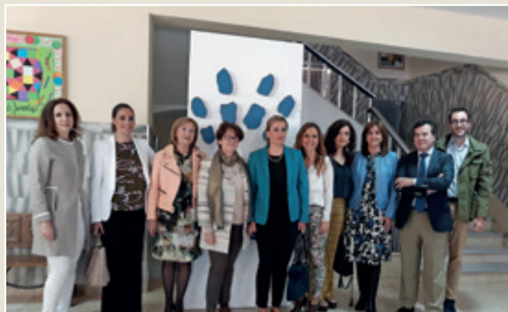
■ Imágenes 6, 7 y 8