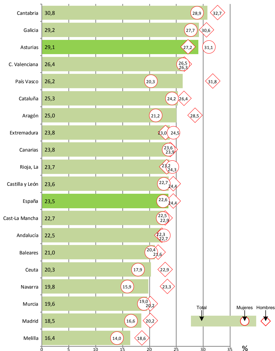
Gráfico 6.2. Tasa bruta de titulación en Formación Profesional de Grado Medio por CCAA. Curso 2016-17.

Finalmente el gráfico 6.3 muestra las diferencias por género en la tasa bruta de titulación en Formación Profesional de Grado Medio por administraciones educativas. En el conjunto nacional la tasa bruta de los hombres (24,4%) supera en 1,8 puntos porcentuales a la de las mujeres (22,6%). En la mayoría de las administraciones educativas se mantiene esta tendencia, si bien con importantes variaciones. En Baleares, Canarias, Castilla-La Mancha, Castilla-León, Cataluña, Comunidad Valenciana, Galicia y Murcia la diferencia a favor de los hombres es relativamente pequeña y no alcanza el 3,6%. Por otra parte, hay un grupo de administraciones donde la diferencia nacional se duplica situándose por encima del mencionado 3,6%. En este caso el rango es muy amplio. Por ejemplo, en Madrid (3,6%) y Cantabria (3,8%) los valores no