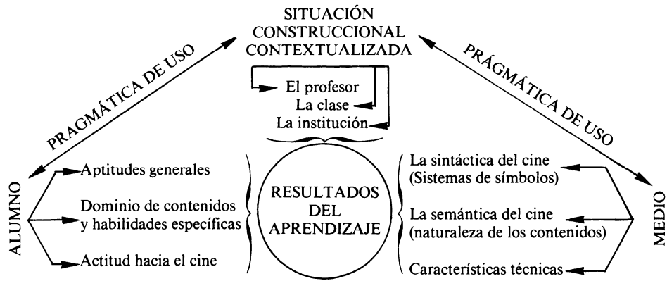
GRAFICO I. MODELO PARA EL ANÁLISIS DEL CINE DIDÁCTICO