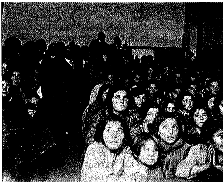
Fotografía núm. 5.- SESION DE CINE EN UN PUEBLO DE LA PROVINCIA DURANTE LA MISION DE 1933.