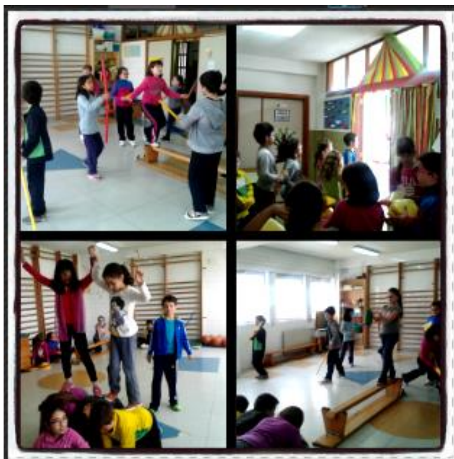
Imagen de los ensayos con los alumnos de 3º de Primaria

Era muy gratificante observar la diversidad de espectáculos que iban saliendo de la propia imaginación y creatividad de los niños. Me di cuenta de la necesidad también de la colaboración de mi tutora en este proyecto, ya que no es fácil trabajar con un número tan elevado de alumnos en actividades donde las distracciones suelen ser normales.