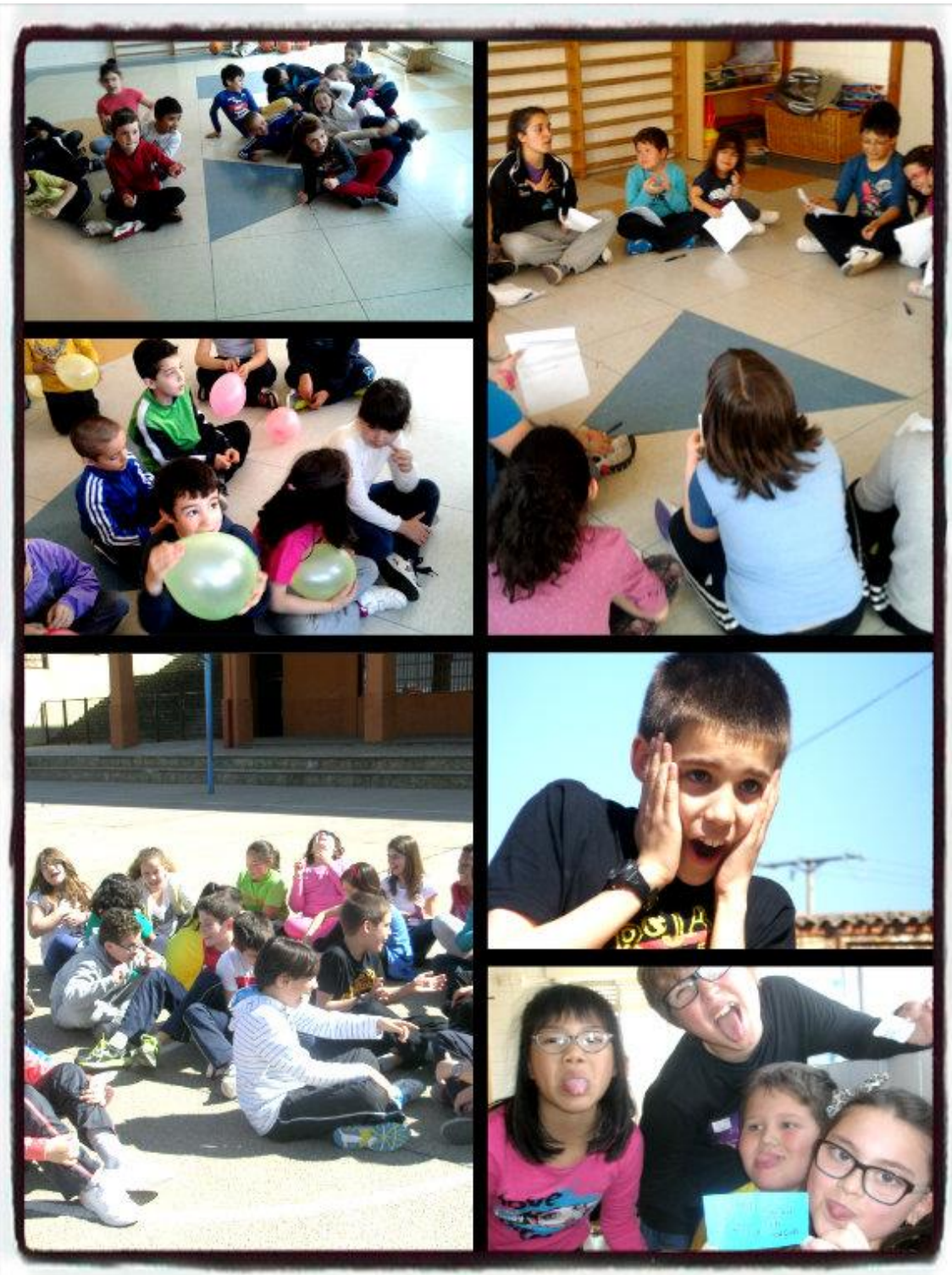
Imágenes de la sesiones de clown