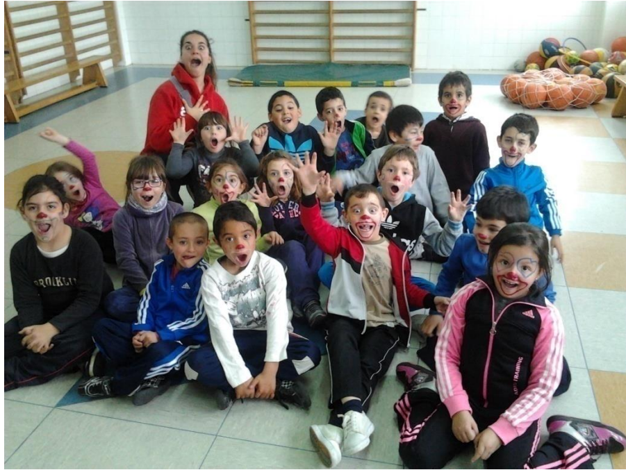
Imágenes con las caras pintadas de payaso