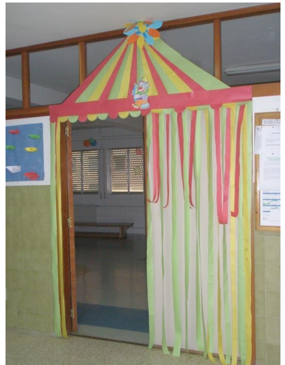
Decorado de la entrada y el interior de gimnasio