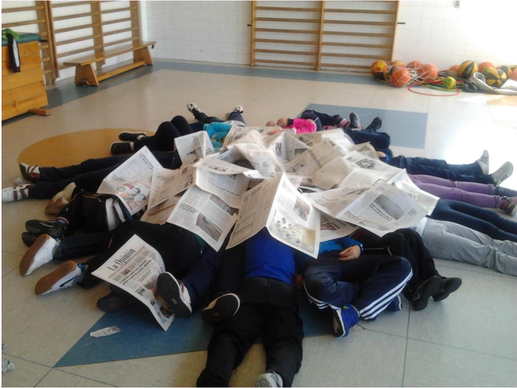
Sesión de Risoterapia con alumnos de 1º de Primaria