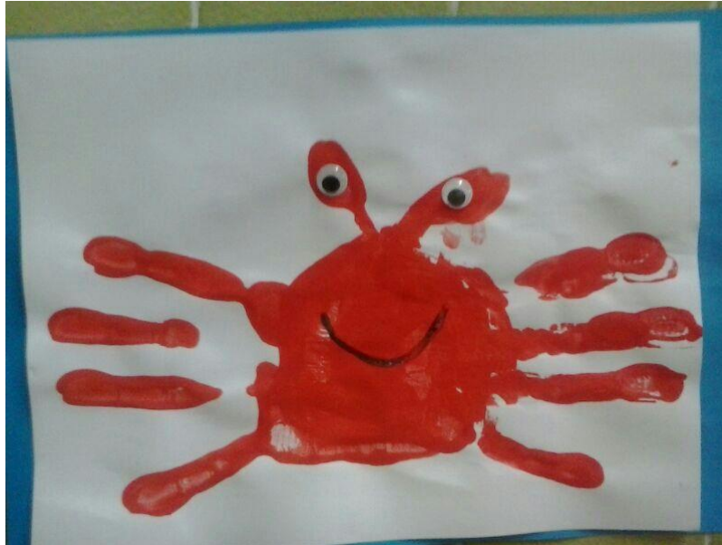
Imagen de los resultados del taller

Por ello los niños nacen creativos, su mente quiere descubrir lo que le llama la atención, aquello que de repente le impresiona, para cogerlo, tocarlo, pintarlo... porque si sólo le pones una pintura de color en las manos para que pinte un dibujo plasmado en un papel que ya viene representado no le estas dando pie a que sea él el que plasme sus ideas. Sé que esta reflexión es difícil de llevar a la realidad pues el niño necesita también una guía, algo sistematizado, para que no se salga del papel pero no es imposible el hacerle ver que el equivocarse, el pintar rompiendo con lo estructurado, reflejar lo que uno imagina es una forma de crecer sintiéndose artista.