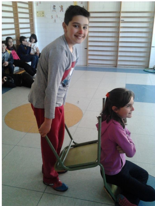
Juego de la sesión Flopi Flopi (alumnos de 5º de Primaria)