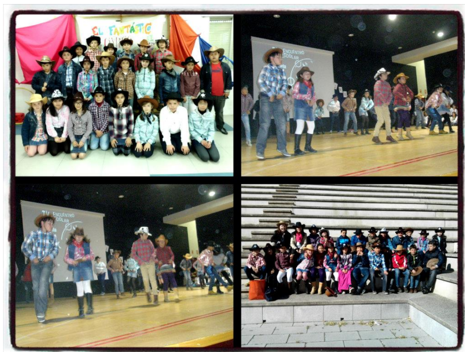
(Los alumnos de 4º en el anfiteatro y en el escenario durante la actuación) 25/4/2014

Este encuentro se lleva a cabo con colegios de la provincia de Zamora, donde pueden apreciarse una diversidad de bailes que permiten incentivar la práctica de la danza entre los niños. Una manera innovadora de quitar el miedo escénico desde pequeño, arropándose con aquellos compañeros que sacarán lo mejor de ti y guiado por unas profesoras que sabrán agradecer el esfuerzo realizado