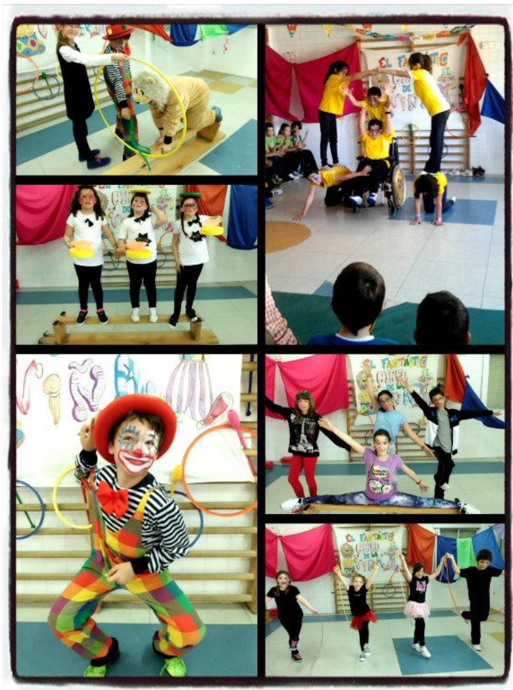
Alumnos de los diferentes cursos realizando la función de circo

Cada actuación suponía poder darle mayor valor al arte escénico, llevándolo dentro de las aulas de un colegio abierto a toda propuesta y expresar al máximo una idea innovadora con el fin de sacar sonrisas en las que se refleje un aprendizaje distinto y que recordarán toda la vida.