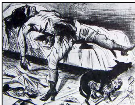
Imagen 3. Otto Dix. Lustmord (crimen sádico)

Por su parte, las artistas han ofrecido necesariamente visiones diferentes de este tipo de violencia que les toca tan de cerca. Uno de los mejores y más tempranos ejemplos de esa diferencia es el tratamiento que Artemisia Gentileschi hizo del tema de Susana en el Baño en el siglo XVII. Artemisia nos enfrenta con el acoso como una