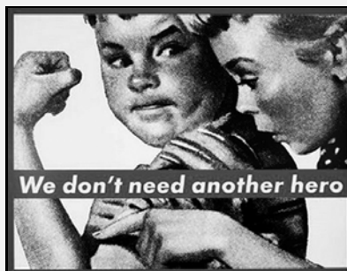
Imagen 7. Barbara Kruger S/T (no necesitamos otro héroe) .