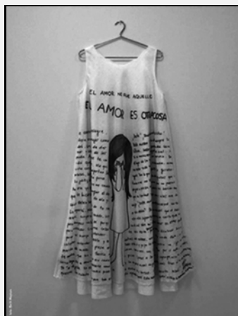
Imagen 5. Beth Moyses El amor es otra cosa.