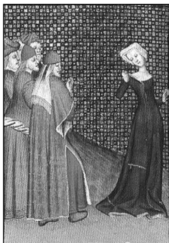
Imagen 1. Cristine de Pizan. Hombres atacando a una mujer

En la primera sesión se hace una exposición de diversas miradas hacia la violencia de género que ofrece el arte a lo largo de la historia a partir de una veintena de obras de arte creadas por artistas - tanto hombres como mujeres-, a las que se acompaña de algunos textos con los que se busca orientar la visión y facilitar la reflexión y el posterior debate.