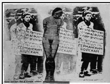
Imagen 6. Nancy Spero. Ballad of Marie Sanders .

II. A partir de la lectura del poema de Bertold Brecht, La balada de Marie Sanders (Anexo 2) sobre la tortura de una mujer judía acusada de prostitución por la GESTAPO, comentar la obra que Nancy Spero realizó inspirándose en este texto. Ambas obras artísticas permiten la reflexión y el debate en torno a la utilización de la violencia de género como “arma política”.