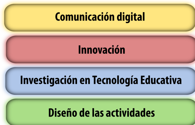
Figura 2. Identificación de categorías claves del Programa de Educación Digital en modalidad virtual. Fuente: Elaboración propia.

Desde la definición de categorías por asignatura del programa, se procedió a delimitar cuatro grandes categorías del programa de Máster en Educación Digital. Estas categorías se constituyen en los factores de éxito de un programa en modalidad en línea.