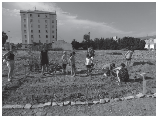
Figura 1. Profesores, madres y alumnos cultivando el huerto escolar.

La construcción de sistemas integrados de intervención para la cohesión social de los usuarios desfavorecidos, es un elemento de importancia estratégica y se basan en el conocimiento de la naturaleza multidimensional de la condición de exclusión social (Moulaert et al., 2010). Lo que se traduce en un estado de exclusión económica y social, pero también en deficiencias relacionales y sociales, culturales y educativas. Las nuevas prácticas de participación ciudadana toman la forma de iniciativas de innovación social promoviendo el desarrollo comunitario y el diferente uso de los espacios públicos (figura 1). Formulación que la madre de un alumno de primaria trató de expresar a través de la fotografía siguiente, elegida entre las 15 que se realizaron con tal propósito.