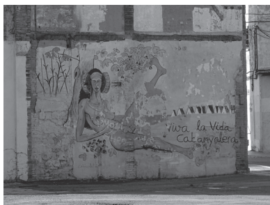
Figura 5. Imagen de un grafiti del barrio.

En definitiva, resulta urgente empezar un proceso de alfabetización visual (Martin, 1990) para impulsar la reflexión sobre las imágenes como campo de acción de las estructuras, prácticas y teorías que definen el espacio urbano global y, por tanto, el contexto de la vida. La formación en este ámbito, contribuye a entender que tomar o elegir una fotografía es un acto crítico y como contenido educativo se convierte en motivo de reflexión y cuestionamiento sobre lo visible, sobre la representación de una supuesta realidad sociocultural y política.