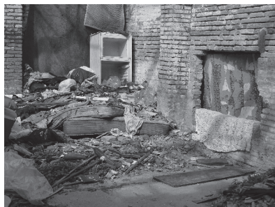
Figura 2. Solar del barrio que aparece en los medios.

La progresiva re-gentrificación del barrio con fines especulativos, ha impulsado una transformación territorial que ha involucrado aspectos espaciales-estructurales, sociales, culturales y lingüísticos, influyendo también en la relación dinámica entre la comunidad local, el lugar y el sentido de comunidad. A fin de superar críticamente el posible efecto de exclusión, se le propuso al profesorado de infantil del centro, reflexionar sobre el grado en el que sus alumnos y alumnas se percibían concernidos por imágenes que normalmente utilizan los periódicos locales para describir el contexto urbano.