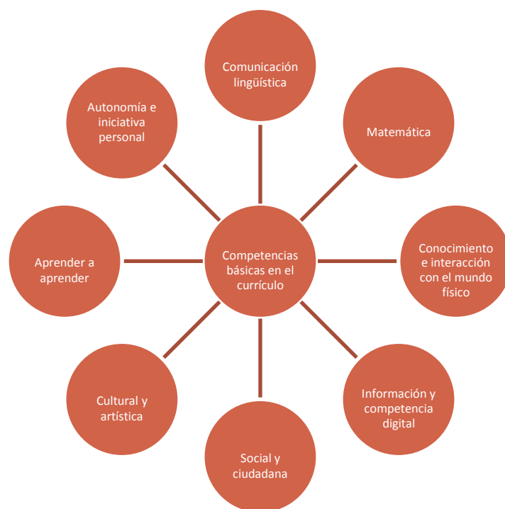
Figura 1. Competencias básicas en el currículum recogidas en la Ley Orgánica de Educación de 2006

Algunos ejemplos para el trabajo de estas competencias mediante las Actividades en el medio natural son los siguientes: