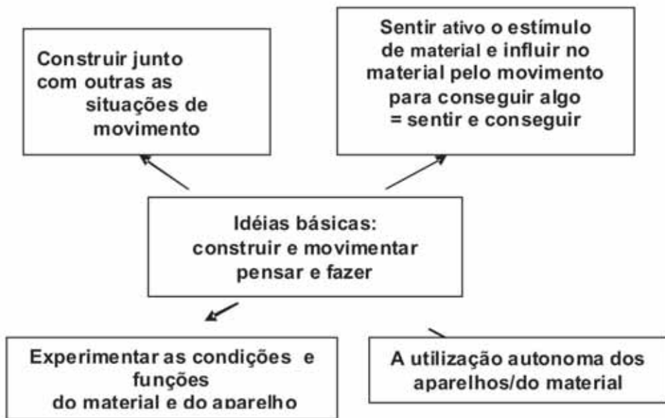
Fig. 1 Objetivos pedagógicos.