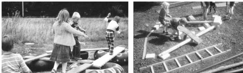
Foto 5 e 6: Oficina de movimento com crianças com material do dia dia

descer,.... Também neste processo as crianças conhecem as qualidades e leis físicas do material como a divisão/o espaço do material, o peso, a elasticidade resp. estabilidade, a qualidade da vibração, oscilação resp. a giratoriedade. No uso e na combinação (isto é, na ação ativa) são experimentadas as relações de grande e pequeno, largo e estreito, comprido e curto, áspero e escorregadisso/liso, duro e mole, pesado e leve e móvel e imóvel. No aspecto social podemos constatar que as crianças constroem sozinhas ou com outras juntas suas situações de movimento com a ajuda dos elementos de construção na oficina de movimento.