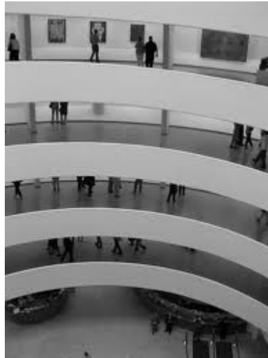
Museo Guggenheim de N.Y.

Con el Museo Guggenheim de Nueva York, F.L. Wright, experimentó con formar curvas para que tuviera espacios luminosos con luz controlada y un espacio para disfrutar de las obras sin rupturas en la exposición al ascender de manera continua por una rampa.