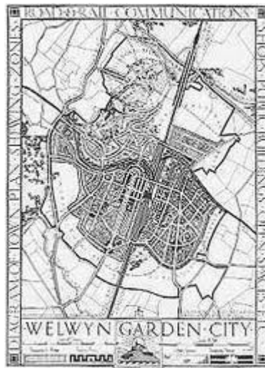
Welwyn Garden City

La construcción de la primera ciudad-jardín empezó a 55 Km de Londres (Letchworth), pero la más famosa es la Welwyn Garden City. España también tiene ejemplos, como en Málaga.