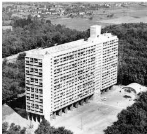
Unidad de Habitación (Marsella)

En 1935, en su tratado Le Modulor , recoge todas sus propuestas urbanísticas. Una de las primeras obras en las que refleja lo escrito es la Unidad de Habitación de Marsella (1946-1952), destinado a familias de clase obrera, habitable y a buen precio.