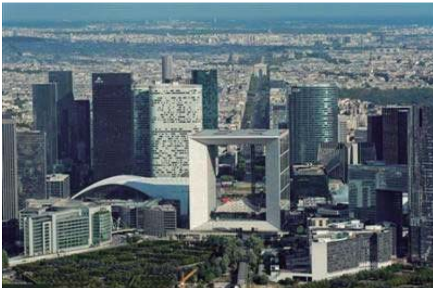
Quartier de la Défense

Au milieu du XXe siècle l'État français a envie de donner à Paris un nouvel air plus moderne dans un espace qui deviendrait un lieu de travail ainsi qu'un attrait pour un tourisme différent, à la recherche de la plus moderne architecture: le quartier de la Défense. Il a été construit sur le prolongement de l'axe des Champs-Élysées.