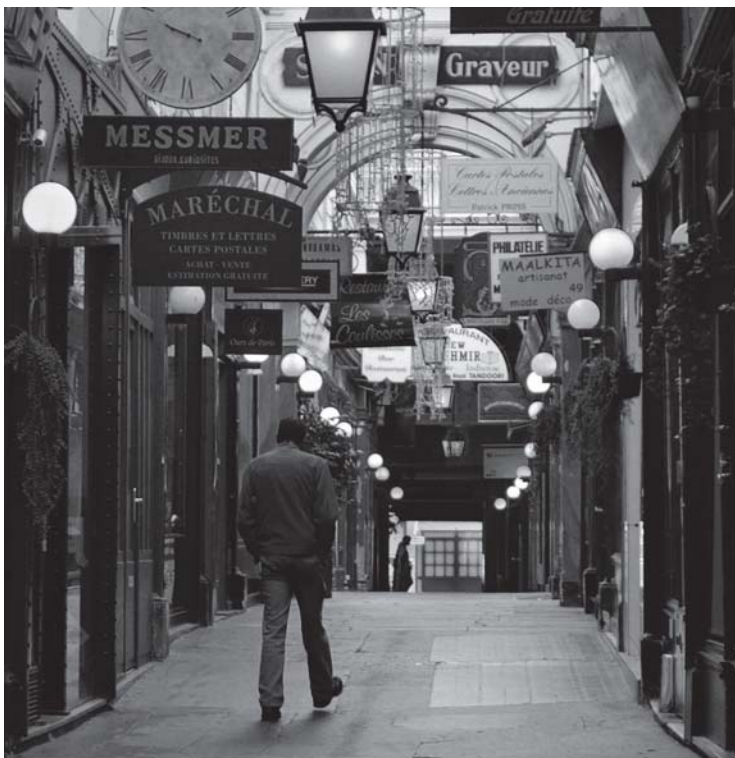
Passage des Panoramas (Paris)

Les premiers passages datent du XVIII e siècle. Ils servaient à unir deux rues, plus tard, couverts, ils vont former des galeries; ils sont devenus un lieu de rencontre dans les cafés et de flânerie en même temps que l'on peut exercer le commerce. Ils sont couverts par des verrières qui vont permettre l'entrée de la lumière naturelle par le haut.