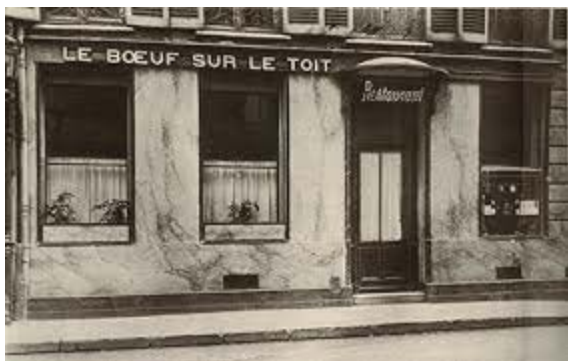
Le boeuf sur le toit