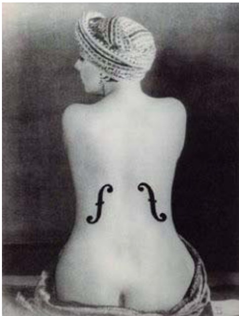
Photographie de Man Ray: Le violon d'Ingres

Paris est un véritable creuset de cultures dans l'entre-deux-guerre dont on a un échantillon ces jours-ci, dans une exposition qui présente la Phillips Collection des tableaux de peintres depuis le Romantisme jusqu'à l'expressionnisme abstrait.