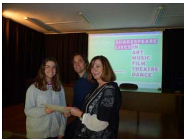
Alumna ganadora del certamen nacional “Shakespeare y yo” (2016) haciendo entrega del premio en material escolar para IES Fortuny

Finalmente, no debemos olvidar que en temas de educación los frutos se recogen mucho tiempo después. Por esta razón, los profesores nos encontramos a menudo en situaciones en las que tenemos que ejercitar nuestra paciencia y nuestra fe en los resultados futuros. El bilingüismo es una de ellas.