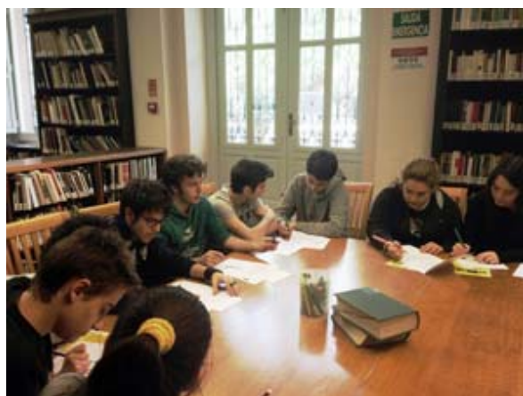
Alumnos del IES Fortuny en un taller de poesía del Instituto Americano

Una vez cumplido el ciclo de seis cursos bilingües en dos promociones, estamos en condiciones de dar unas directrices para abordar este reto, que esperamos sean de utilidad especialmente en los centros que van a iniciarse en el programa bilingüe.