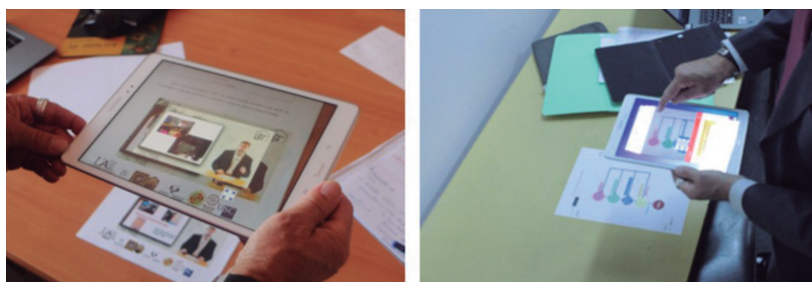
Figura 2. Imagen de uno de los clips de vídeos

Los objetos en RA virtual que se produjeron incorporaban diferentes tipos de recursos: clip de vídeos, vídeos ubicados en YouTube, vídeos transparentes, documentos en pdf, animaciones en 3D, ... En la figura 2, pueden observarse imágenes de los dos objetos producidos.