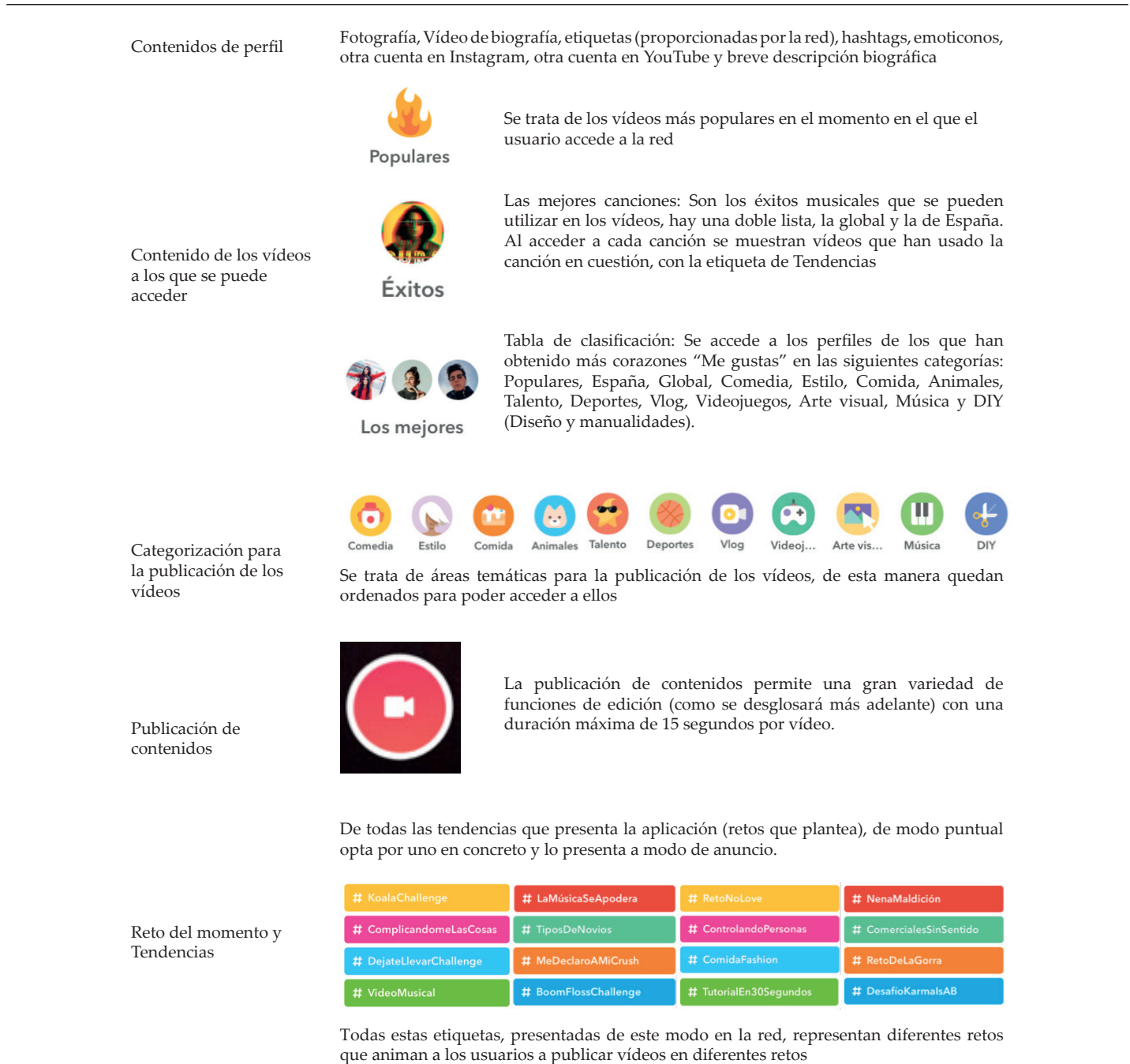
Tabla 3. Estructura mediática de la red Musical.ly según las posibilidades de interacción respecto a las variables de estudio.

A partir de este análisis de la estructura mediática de la red en las cinco variables estudiadas, se presenta un análisis de los perfiles más famosos. Estos datos nos permiten poner en con-