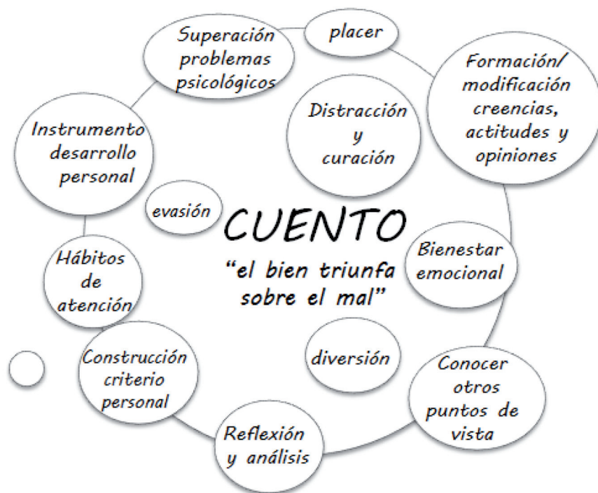
Fig.2. Beneficios del cuento en población infantil hospitalizada

El empleo de la literatura con fines terapéuticos o biblioterapia ha de regirse por una planificación previa, en la que se atiende a la temática y objetivos que se persiguen, a fin de que sean acordes con la edad del paciente.