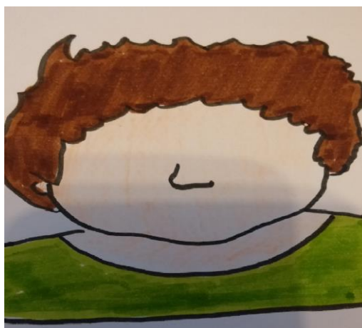
Figura 3.1. Constitución Facial