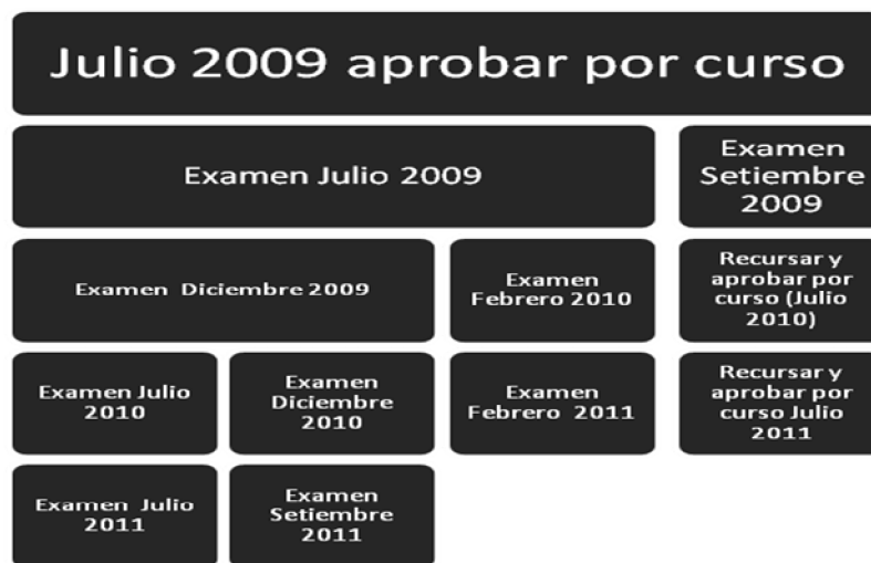
Fig. 1 Instancias de rendición de las asignaturas en el periodo de referencia.

Para el análisis se seleccionó el primer semestre de ingreso a la Facultad y se considera a la procrastinación académica como la tendencia a postergar la rendición de cursos o exámenes, acotado al caso de las cinco primeras asignaturas del ciclo inicial de la FCS. De manera de ser consistente con la definición de procrastinación, no se evalúa la aprobación de la asignatura, sino el hecho de haberse presentado a rendir la materia. Así, aquellos estudiantes que se presentaron a más de una instancia, se los clasificó en la primera convocatoria. En la Fig. 1 se presenta la cantidad de periodos considerados en este trabajo.