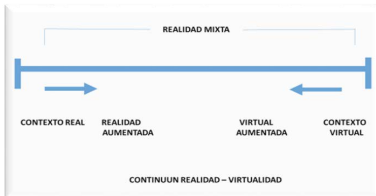
Figura 3. Continuum realidad-virtualidad