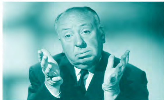
ALFRED HITCHCOCK. DIRECTOR DE CINE BRITÁNICO (1899-1980)

«IMAGÍNESE A UN HOMBRE SENTADO EN EL SOFÁ FAVORITO DE SU CASA. DEBAJO TIENE UNA BOMBA A PUNTO DE ESTALLAR. ÉL LO IGNORA. PERO EL PÚBLICO LO SABE. ESTO ES EL SUSPENSE»