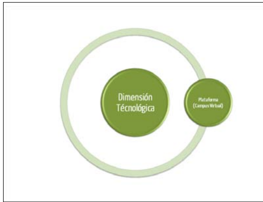
Figura 4. Dimensión tecnológica.