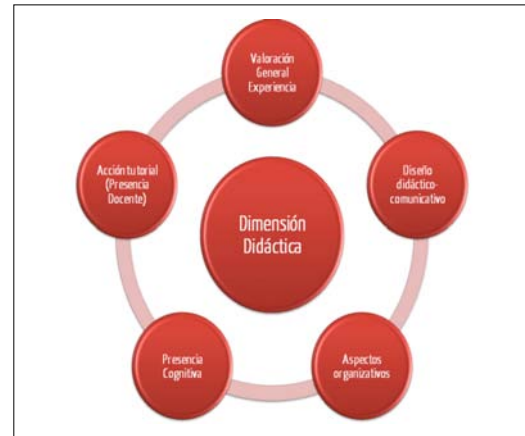
Figura 2. Dimensión didáctica.

En último lugar, se realiza el estudio evaluativo de la aplicación de la acción formativa para la conformación de la comunidad de práctica a través de entornos virtuales obteniendo tres dimensiones. En referencia a la primera dimensión, la «didáctica», el profesorado considera que los ejes claves del éxito han sido la participación, motivación y dinamismo de las estudiantes.