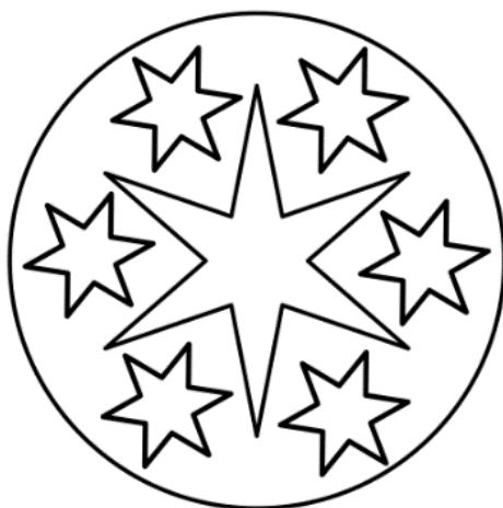
Figura 1: Mándala.

Desarrollo: Se entrega a cada niño un mándala para colorear. En este caso se indica que se pinte la estrella grande de azul, y para las estrellas pequeñas y fondo ellos deciden el color que quieren utilizar. La única regla que tienen que respetar es pintar la estrella grande de azul (ver figura 2)