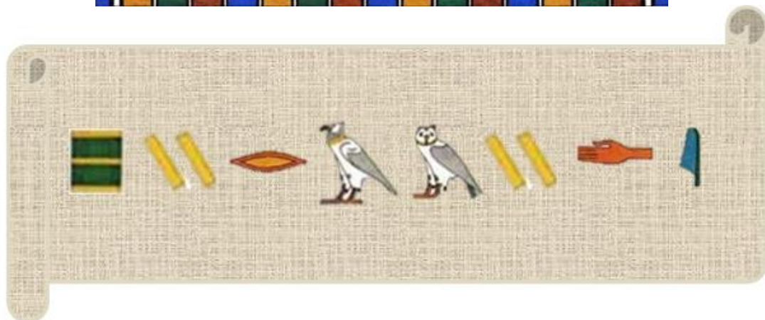
Figura 4: abecedario egipcio y papiro para descifrar la palabra “pirámide”.