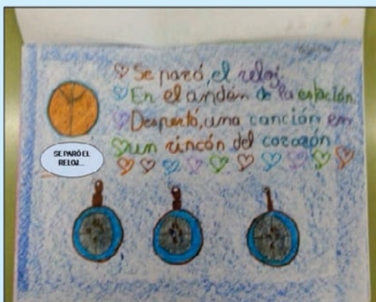
Ejemplo de la primera parte de la canción con su ilustración

tivos como la integración y la solidaridad.