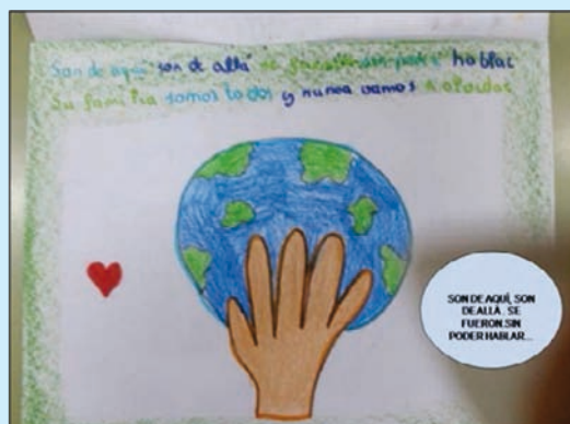
Ejemplo ilustrado de una estrofa de la canción

tivos como la integración y la solidaridad.