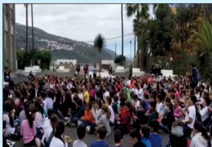
El alumnado interpretando la canción en Lengua de signos

Con estas líneas, dejamos constancia de que desde la Música todo es posible. Por ello, animamos a los centros educativos a que utilicen la Lengua de signos como recurso musical, pues favorece el aprendizaje y se fomentan y desarrollan, entre otros, valores educa-