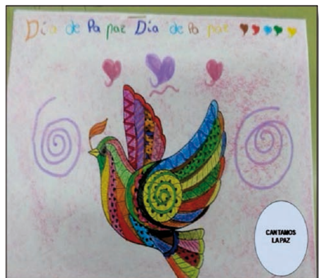
Ejemplo de portada de la canción mediante ilustraciones

Desde esta perspectiva, se trabajó desde distintas áreas, pues la temática de la no violencia y la paz fue el núcleo fundamental de aprendizaje durante ese mes. Además, se reforzó la letra de la canción desde el área de Educación Emocional y para la Creatividad, realizando incluso ilustraciones de las frases de la canción. Esta forma de trabajo contribuye a que el aprendizaje sea interdisciplinar y cooperativo, tanto entre el alumnado como entre el profesorado.