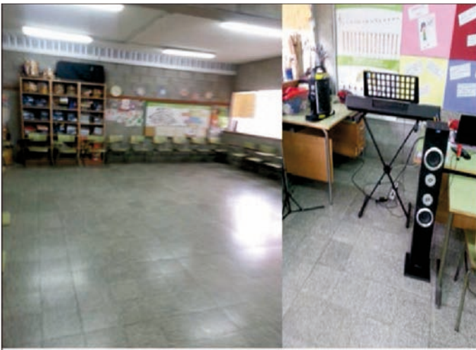
El aula de Música, un lugar divertido para el aprendizaje

El aula de Música es un lugar en el que el alumnado del CEIP Baldomero Bethencourt Francés aprende y se divierte desde una perspectiva activa y participativa, por lo que se utilizan recursos motivadores que propician que el alumnado se beneficie de ellos para ser grandes artistas, especialmente músicos “sin barreras”. Cuando decimos “barreras” nos referimos a no sentir temor o inhibirse ante cualquier obstáculo y aprender de muchas formas, especialmente siendo solidarios/as con toda aquella persona que presente dificultades auditivas, pues nuestro Centro es preferente para este tipo de alumnado.