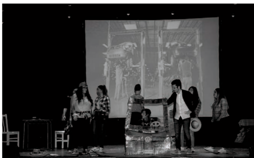
IV Drama Meeting, alumnado de Educación Secundaria

El alumnado de 2º y 3º de la ESO del IES Villalba