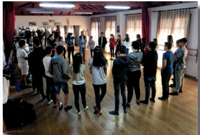
Talleres con alumnado asistente a Jornada de convivencia previa al V Drama Meeting