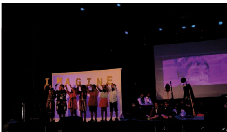
IV Drama Meeting, alumnado de Educación Primaria

llegar, en esta ocasión, a contar con trece centros participantes en este espectáculo en Lenguas Extranje-