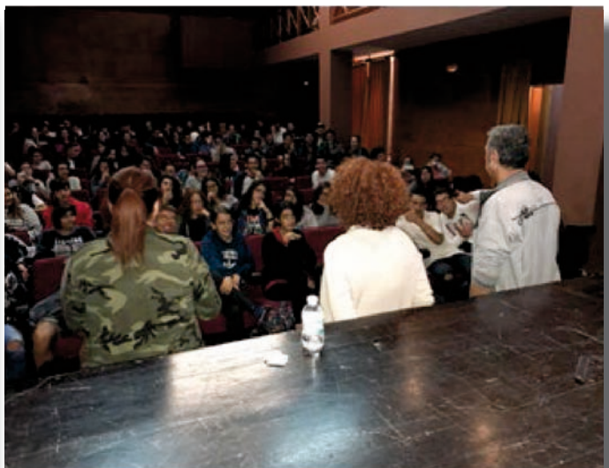
Puesta en común posterior a dinámicas con actor y actrices.