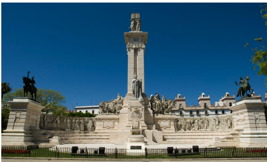
Monumento a la Constitución de 1812 (Cádiz)