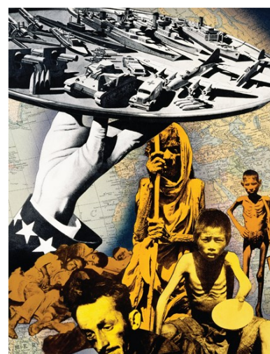
“Un donativo para los pueblos hambrientos” Josep Renau, Museo de la Ciudad de México

Pese a la adquisición de la independencia por parte de los países del denominado Tercer Mundo, estas naciones mantienen en la actualidad una relación de dependencia económica, tecnológica y cultural con sus antiguas metrópolis.