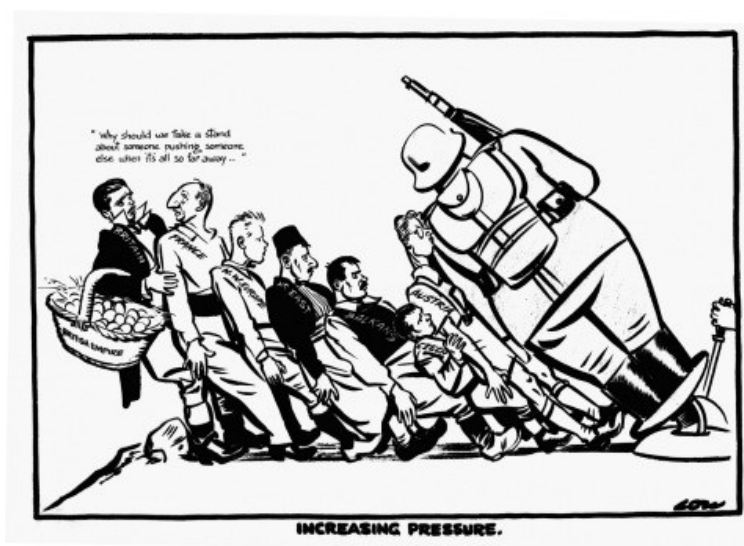
"Incrementando la presión". Viñeta de David Low.

Documento 2. Las causas de la guerra. La política de apaciguamiento