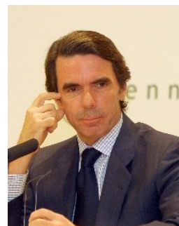
José María Aznar