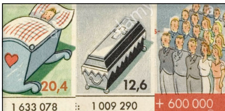
Cartel de propaganda nazi

Documento 1. Las causas de la guerra. Teoría del espacio vital. Alemania, 1938