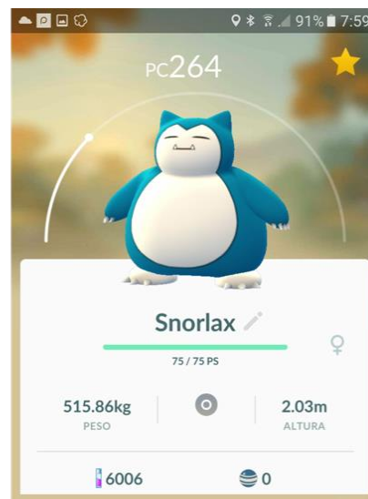
Los nombres de los Pokémon son marca comercial de Nintendo.